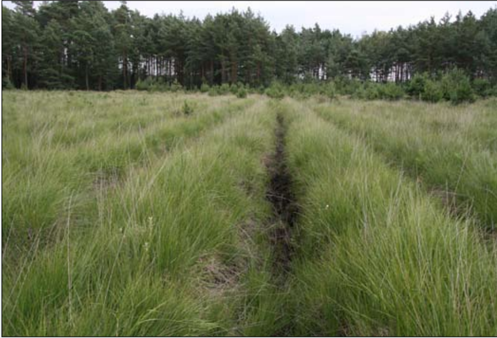
Fot. 6. Torfowisko w Borach Dolnośląskich zniszczone i przesuszone w wyniku prób zalesienia – „zaproszenie” do inwazji tawuły kutnerowatej Spiraea tomentosa