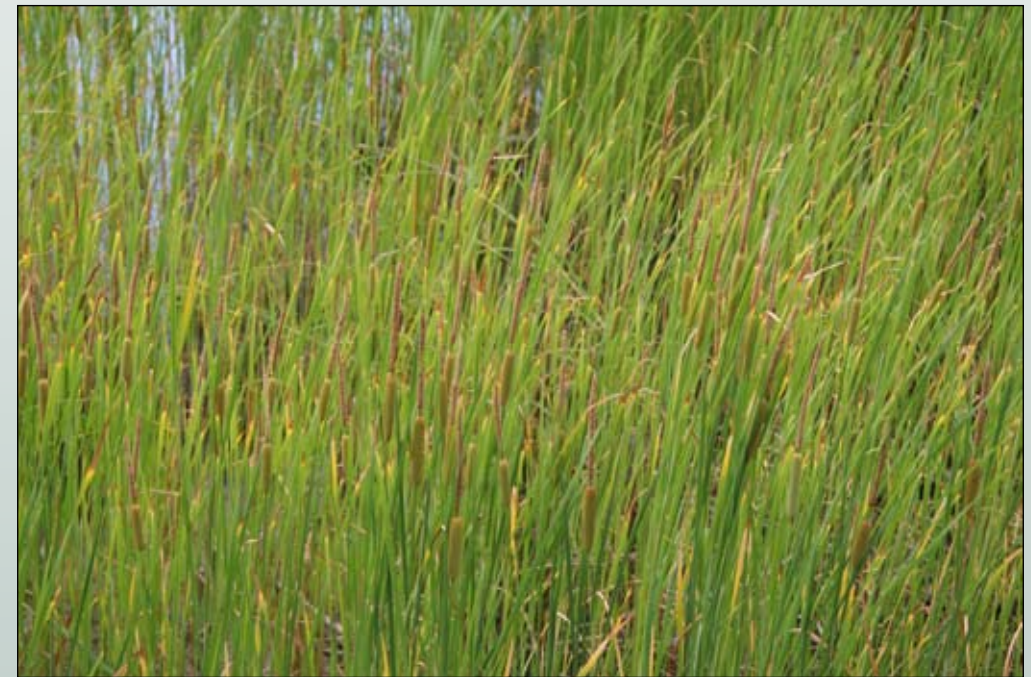
Fot. 42. Fragment zbiorowiska z dominacją pałki wysmukłej (Fot. A. Nowak)