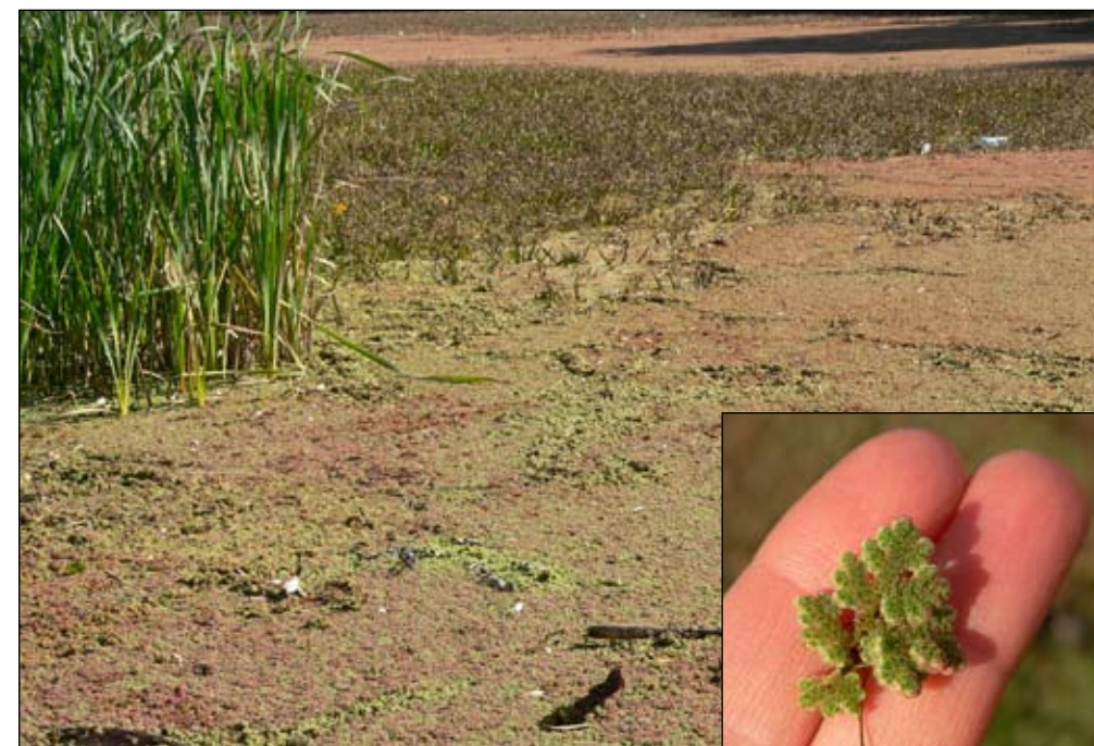
Fot. 18. Azolla paprotkowa Azolla filiculoides na starorzeczu Odry we Wrocławiu i pojedyncza roślina (Fot. E. Szczęśniak)

Czas i drogi zawleczenia: Do Europy Azolla filiculoides została sprowadzona pod koniec XIX w. (Willmans 1976). Gatunek ten pojawiał się niezależnie i jednocześnie w wielu punktach, zawlekany z wodami balastowymi, narybkiem itd. lub świadomie wypuszczany do zbiorników wodnych. W bezpośrednim sąsiedztwie Polski był notowany w Niemczech, gdzie jest częsty (Weber 2005), w Czechach (Kubát 2002), na Słowacji (Hrivnák 2007) oraz na Litwie, gdzie jego pojaw był efemeryczny (Grudziński 2000). Rozprzestrzenia się zoo-, anemo- lub hydrochorycznie oraz w wyniku różnorodnych ludzkich działań, które można nazwać szeroko pojętą antropochorią.