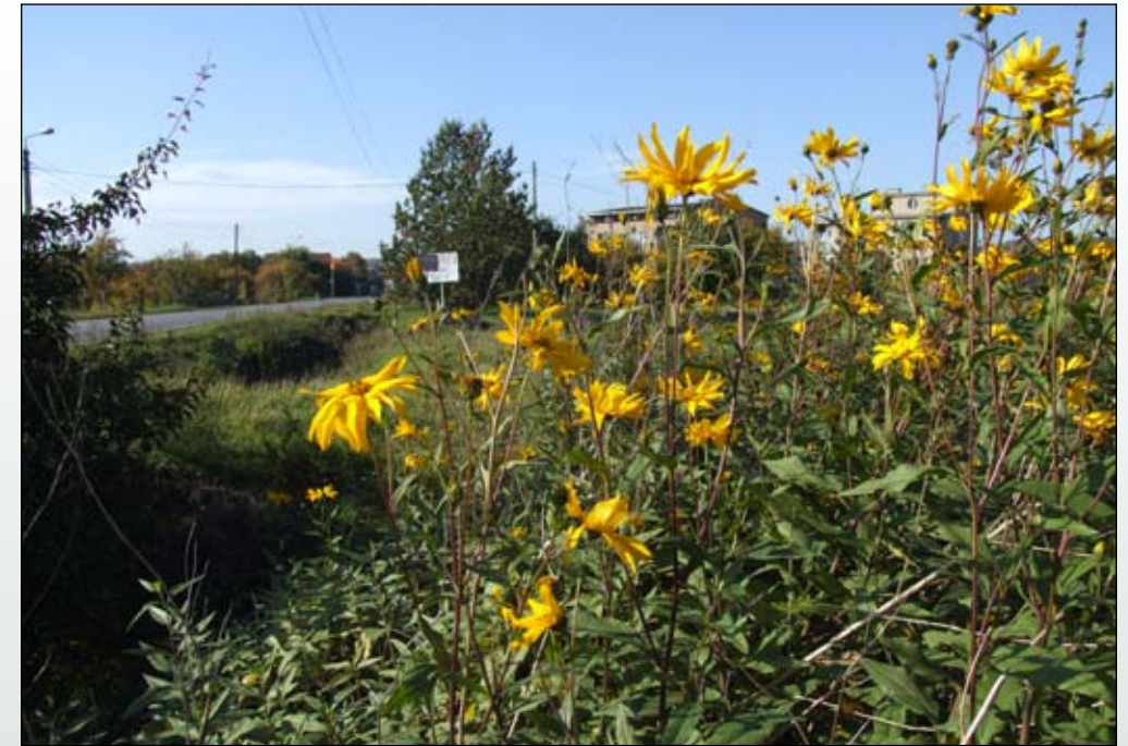
Fot. 69. Słonecznik bulwiasty na przydrożu w Dąbrowie Górniczej

Zajmowane siedliska: Kolonizuje przede wszystkim siedliska wilgotne: brzegi rzek i zbiorników wodnych. Jest częstym składnikiem nitrofilnych zbiorowisk bylin i pnączy na siedliskach ruderalnych (Fot. 69) i nad brzegami zbiorników wodnych (Fot. 70) z klasy Artemisietea vulgaris (Matuszkiewicz 2001). Ma małe wymagania siedliskowe, występuje zarówno na glebach piaszczystych jak też na glebach żyznych i zasobnych w azot. Jako roślina ruderalna częsty jest na nasypach kolejowych, przydrożach, nieużytkach, wysypiskach śmieci i gruzu oraz na przychaciach.