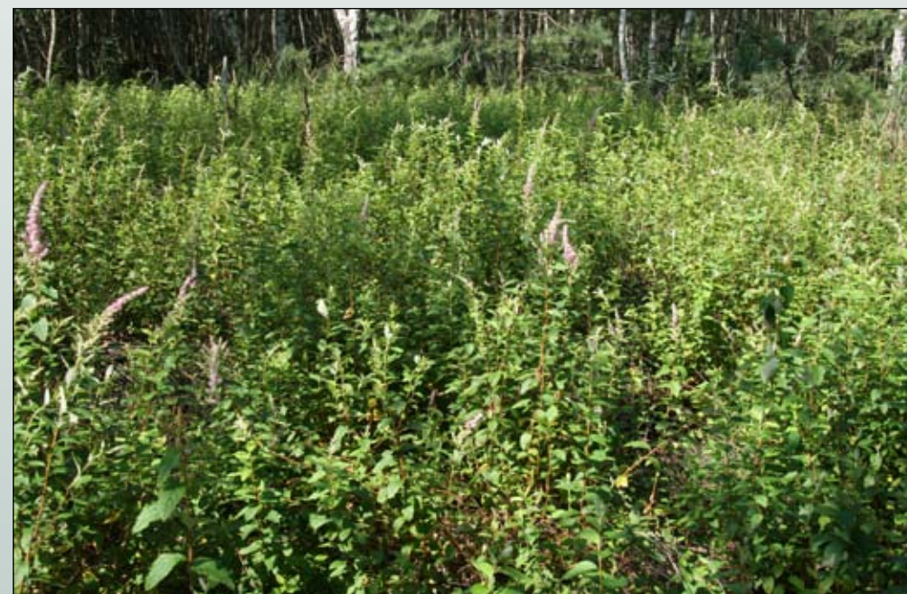
Fot. 77. Zwarte łąny tawuły na torfowisku Linkowo w Puszczy Drawskiej