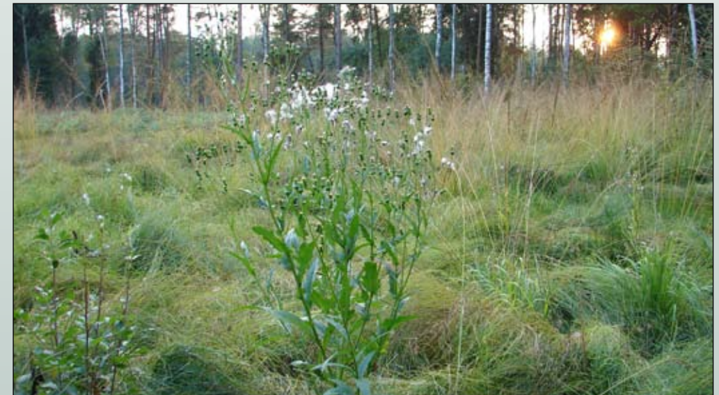
Fot. 21. Erechtites jastrzębcowaty to roślina najczęściej spotykana na wilgotnych zrębach