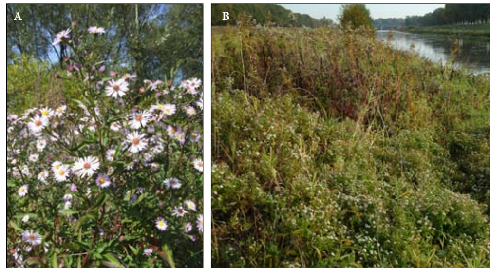
Fot. 49. Aster nowobelgijski Aster novi-belgii : A - w zaroślach wierzbowych w dolinie Nysy Kłodzkiej, w okolicy Długopola Górnego, B - nad kanałem powodziowym we Wrocławiu

Rejony występowania: Północnoamerykańskie astry występują na terenie całego kraju po obszarze górskie, m.in. w Karpatach: Polica 460 m n.p.m, Zakopane 820 m n.p.m. (Solarz i in. 2005). Jed-