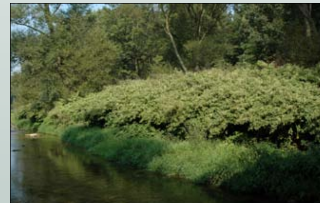
Fot. 14. Brzegi Kwisy w Mirsku opanowane przez zarośla rdestowców