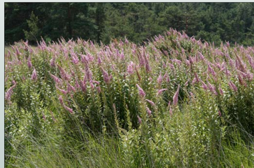
Fot. 73. Tawuła na obrzeżach torfowiska Zacisze w Borach Dolnośląskich