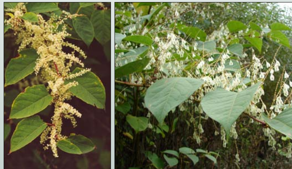
Fot. 58. Kwiaty i oskrzydłone owoce rdestowca ostrokończystego