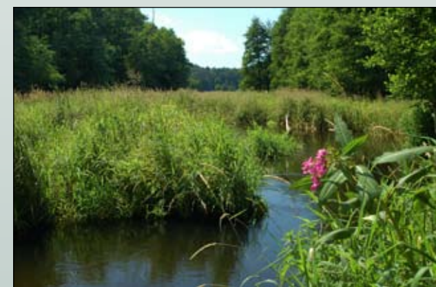
Fot. 11. Do dobrze zachowanego fragmentu doliny Czarnej Hańczy (poniżej Sobolewa) nasiona niecierpka gruczołowatego zostały przeniesione przez wodę z terenów zabudowanych, gdzie gatunek ten jest uprawiany