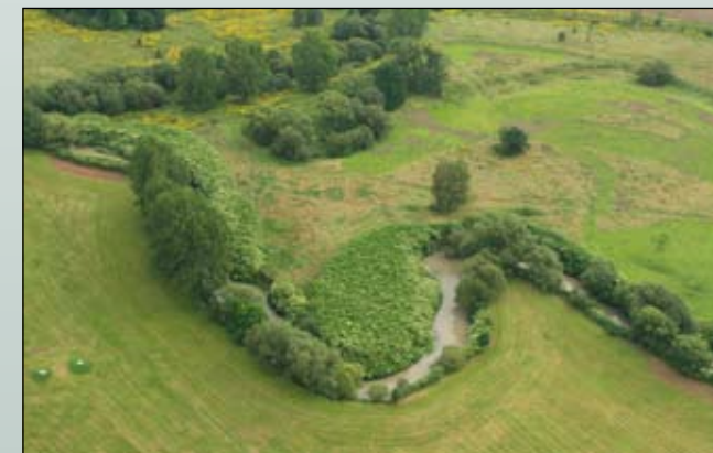
Fot. 17. Brzegi Nysy Łużyckiej poniżej Zgorzelca opanowane przez rdestowce