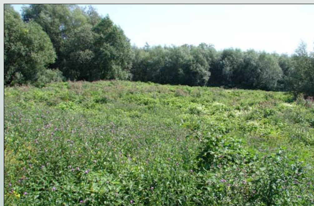
Fot. 92. Regeneracja roślinności na powierzchniach po dwukrotnym zastosowaniu metody mieszanej (wykaszanie i oprysk)