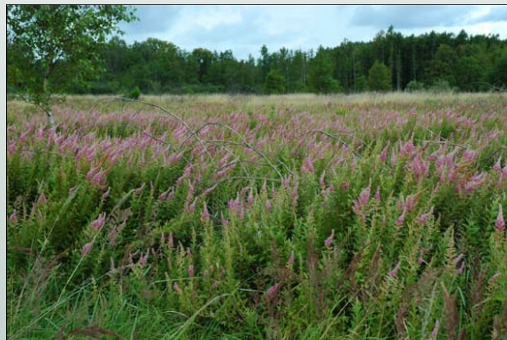
Fot. 75. Tawuła kutnerowa zarastająca podmokłe łąki w dolinie Nysy Łużyckiej poniżej Pieńska (Fot. Z. Dajdok)