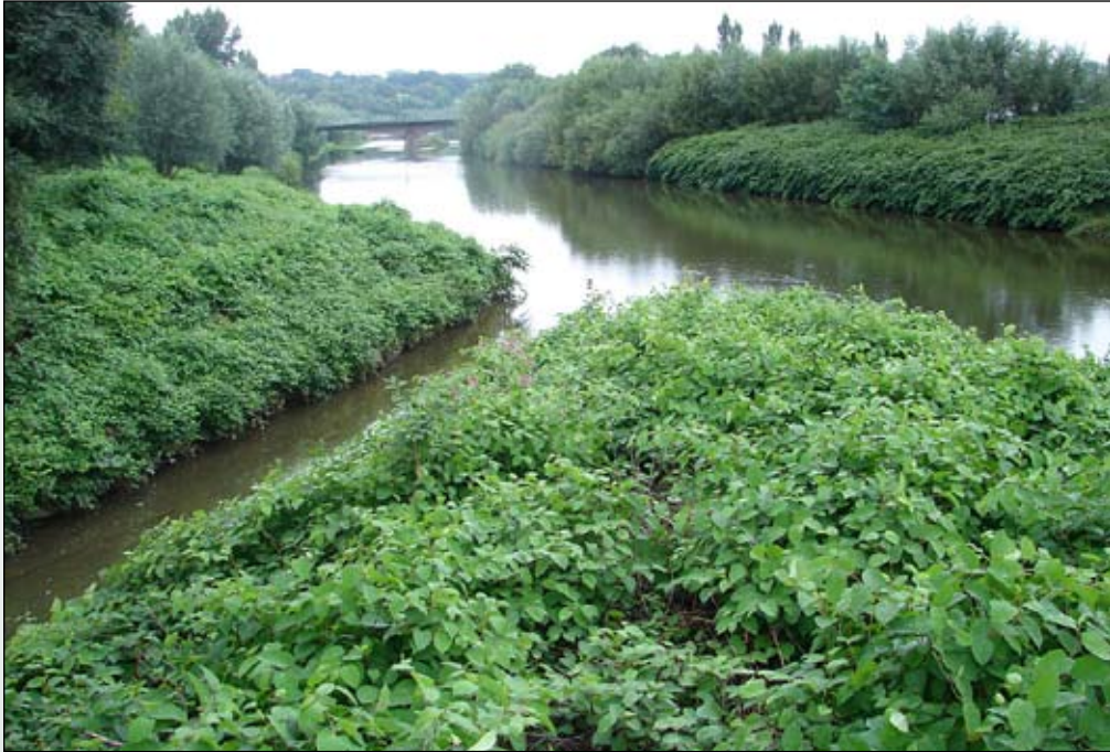
Fot. 66. Fragmenty dolin niektórych rzek w południowej Polsce są zupełnie opanowane przez rdestowce (Fot. B. Tokarska-Guzik)