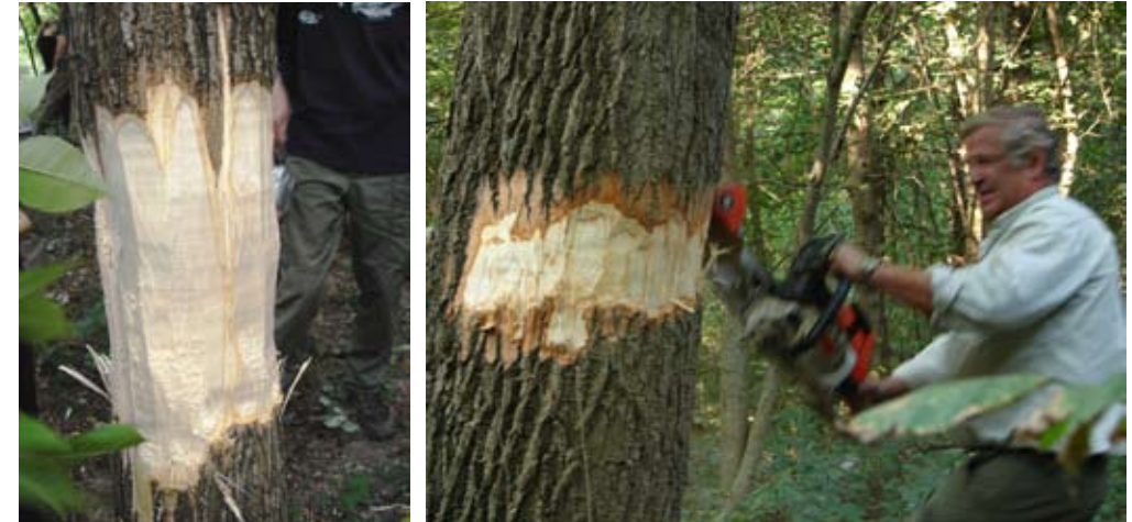
niu zabiegu mechanicznego zwalczania (koszenia)

Fot. 87. Brzegi uregulowanej Wapienicy (Beskid Śląski) porośnięte rdestowcami – przed i po zastosowa-