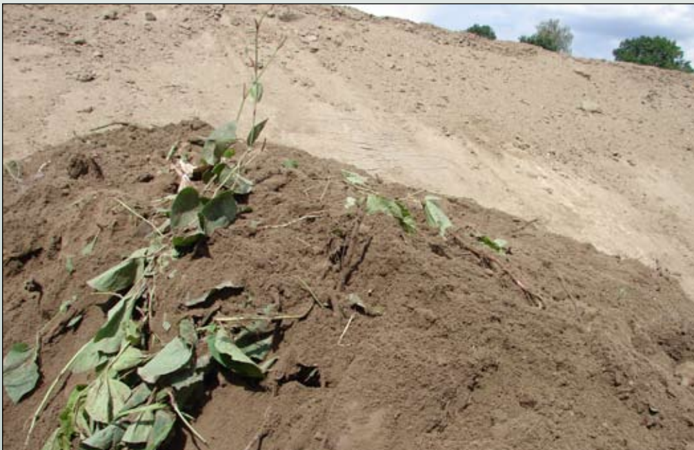
Fot. 65. Kłaczka i pędy rośliny często transportowane są z pryzmami ziemi i w ten sposób rozprzestrzniane. Prace regulacyjne nad potokiem Wapienica, Beskid Śląski

Skala zjawiska jest różna w wielu krajach i regionach. Alarmujące raporty można znaleźć w opracowaniach brytyjskich, w których podkreśla się zagrożenia, jakie stwarza R. japonica w rezerwach przyrody i innych obiektach chronionych oraz na obszarach z zachowaną rodzimą roślinnością (Child i Wade 1999, 2000). Bujny wzrost, duże zwarcie pędów oraz sposób ustawienia liści na zygzakowatym pędzie sprawiają, iż roślina bardzo silnie zacienia powierzchnię gruntu, ograniczając wzrost innych roślin 5 . Liście i pędy tworzą grubą warstwę ściółki, ograniczając kiełkowanie siewek wielu gatunków roślin rodzimych (Richards i in. 1990; Tokarska-Guzik i in. 2006). Silne kłaczka przerastają glebę na 2m w głąb i na 7m od rośliny macierzystej (Richards i in. 1990), a szacowana biomasa części podziemnych do głębokości 25 cm sięga 14 000 kg/ha (Brock 1994).