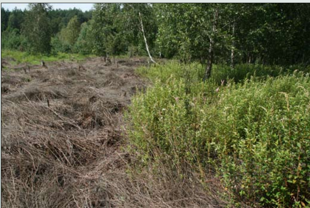
Fot. 108. Z lewej: skutki eksperymentalnego zwalczania chemicznego; z prawej: skutki wycinania pędów tawuły. Stan rok po zabiegach