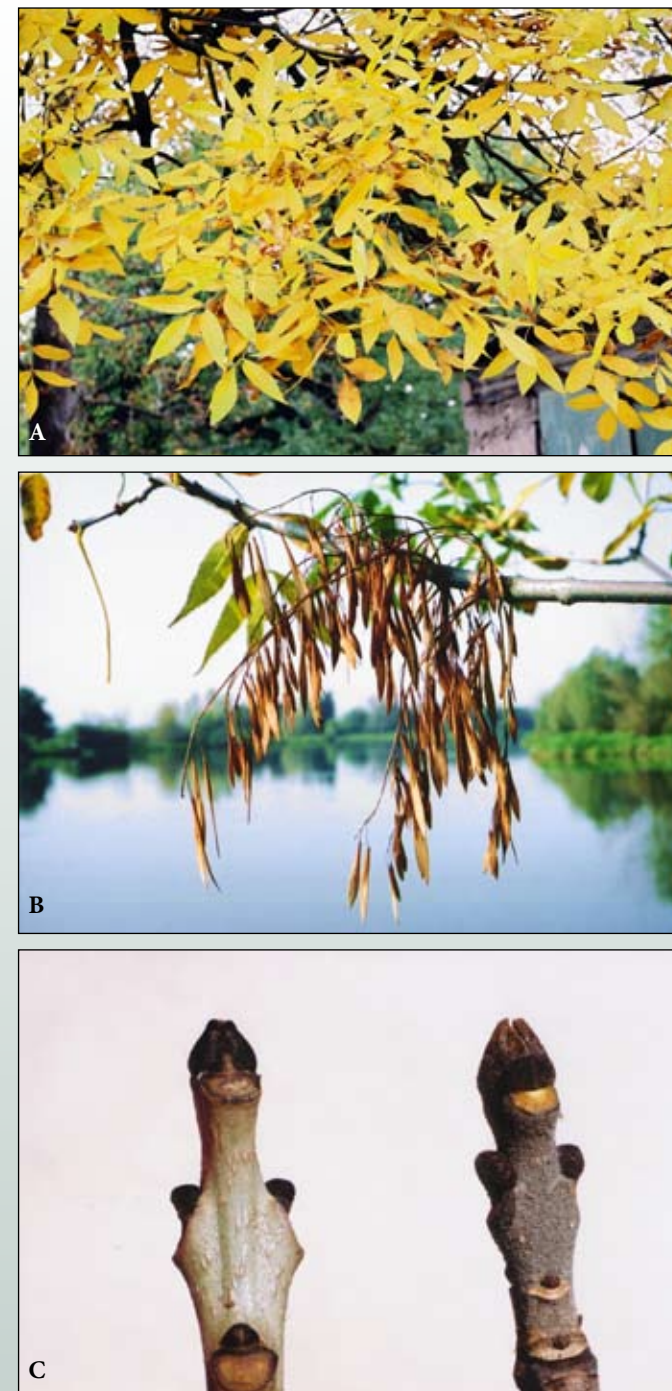
Fot. 86. Jesion pensylwański: A – liście przebarwiające się jesienią; B – owoce (skrzydlaki); C – porównanie szczytowych części pędów jesionu wyniosłego (po lewej stronie) i pensylwańskiego (po prawej)