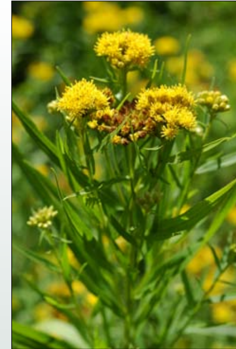
Fot. 54. Pokrój nawłoci trawolistnej Solidago graminifolia

Zajmowane biotopy: W Polsce nawłoc trawolistna stwierdzana jest na przydrożach, łąkach wilgotnych, okrajkach leśnych, ale także na groblach stawowych, w kamieniołomach, na torowiskach i terenach miejskich ((Rostański 1971b; Guzikowa i Maycock 1986; Urbisz 2001; Kompała-Bąba i Bąba 2006; Dajdok i Nowak 2007, Fot. 55). Analiza siedliskowa przeprowadzona na podstawie własności wskaźnikowych gatunków wchodzących w skład poszczególnych płatów roślinności wykazała, że nawłoc trawolistna występuje w Polsce w miejscach dobrze lub umiarkowanie nasłonecznionych, na siedliskach mezo- lub eutroficznych. Podłożem glebowym są różne utwory, w tym gliniaste, piaszczyste a także organiczne. Nawłoc ta może także występować na inicjalnych utworach glebowych tworzących się np. w wyrobiskach skał węglanowych lub na tzw. urbanoziemach - warstwach przemieszanego humusu i skał odpadowych wykorzystywanych podczas rekultywacji wyeksploatowanych wyrobisk. Jest to roślina bardzo tolerancyjna pod względem uwilgotnienia, jak również odczynu podłoża. Jej okazy obserwowano zarówno na piaszczystych, kwaśnych glebach, jak też na alkalicznych rędzinach. Występuje na miejscach