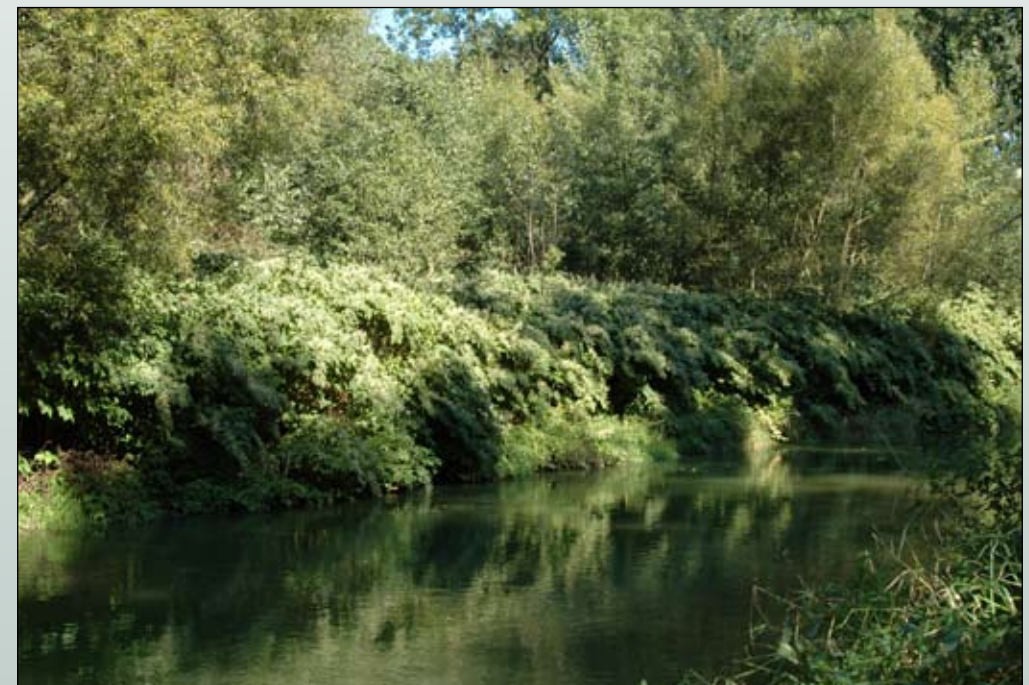
Fot. 2. Nadrzeczne zarośla rdestowców