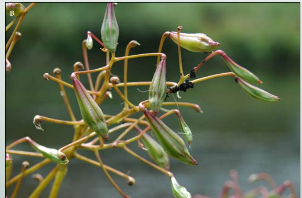
Fot. 25. Kwiaty (A) i owoce (B) niecierpka gruczołowatego Impatiens glandulifera