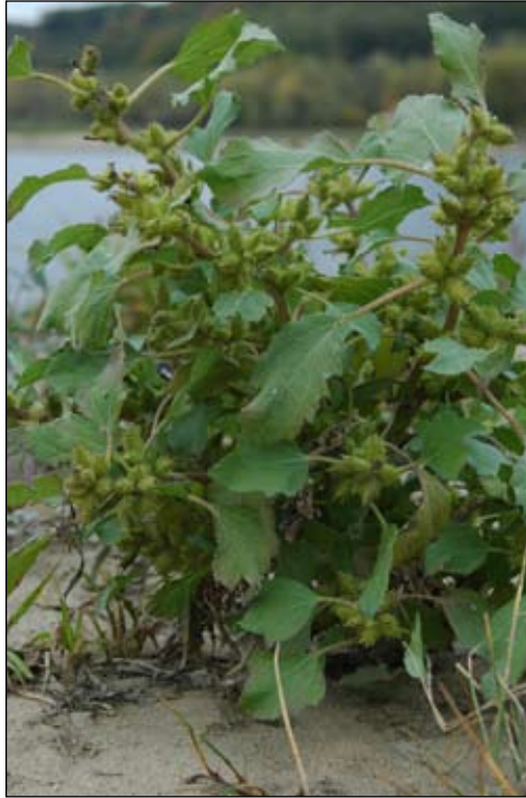
Fot. 30. Rzepień włoski Xanthium albinum na brzegu Wisły we Włocławku

rzek, przymuliskach oraz w otoczeniu starorzeczy. Na siedliskach tych wchodzi w skład zbiorowisk roślinnych złożonych przede wszystkim z gatunków jednorocznych (terofitów) z klasy Bidentetea . Roślinność z dominacją lub znacznym udziałem tego gatunku reprezentuje zespół roślinny Xantho albini-Chenopodietum rubri , znany w Polsce m.in. znad Warty, Odry i Wisły. Skład gatunkowy płatów tego pionierskiego zbiorowiska jest zróżnicowany. Na aluwiach Warty tworzą się dwie postacie siedliskowe. Pierwszą postać stanowią płaty roślinności z przewagą terofitów, które rozwijają się na piaszczystych łąkach. Drugą postać reprezentują zbiorowiska bagiennych murawek zespołu Ranunculo-Alopecuretum z klasy Molinio-Arrhenatheretea i z mniejszym udziałem terofitów (Borysiak 1994). Rzepień włoski rozwija się także na zalewowych łąkach i pastwiskach (Fot. 31). Gatunek ten notowany był także w otoczeniu składowisk odpadów, na terenach kolejowych oraz polach i nieużytkach.