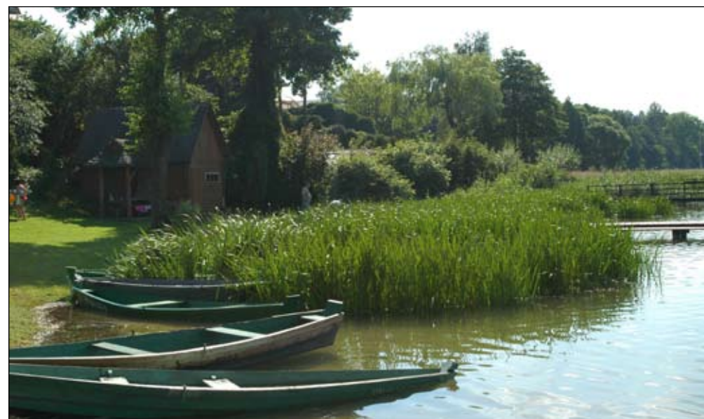
Fot. 48. Szuwar tatarakowy na brzegu Jeziora Wigry przy przystani w Bryzglu

Działania zaradcze: Dotychczas brak danych na temat działań podejmowanych w celu eliminacji tataraku zwyczajnego, a wręcz przeciwnie nawet znane są próby wykorzystania tego gatunku do umacniania linii brzegowej akwenów (Kamińska 2004). Kwestią problematyczną jest sama potrzeba ich podejmowania. Doraźne działania można ograniczyć do mechanicznego usuwania jego skupień (poprzez koszenie szuwarów) w miejscach, w których wykazuje zachowania ograniczające lub eliminujące rozwój szuwaru mannowego. Szuwar ten nie należy jednak w Polsce do zbiorowisk rzadkich lub zagrożonych, brak natomiast doniesień o wkraczaniu tataraku w inne typy rodzimych zbiorowisk szuwarowych.