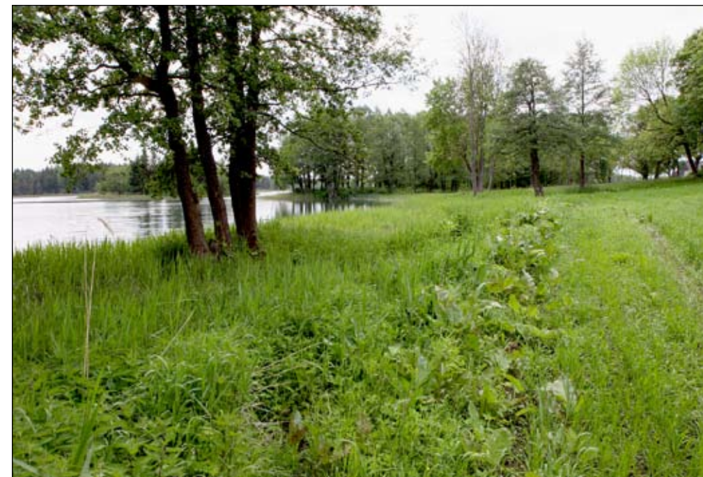
Fot. 101. Brzeg jez. Koleśne - stan w dwa lata po zakończeniu zabiegów zwalczania barszczu Sosnowskiego

Podejmowanie zabiegów czynnej ochrony (w tym przypadku ochrony przed gatunkiem obcego pochodzenia) jakiegokolwiek składnika naszej przyrody wymaga równoległego prowadzenia edukacji przyrodniczej w tym zakresie. Tylko wówczas będziemy mogli skutecznie, z