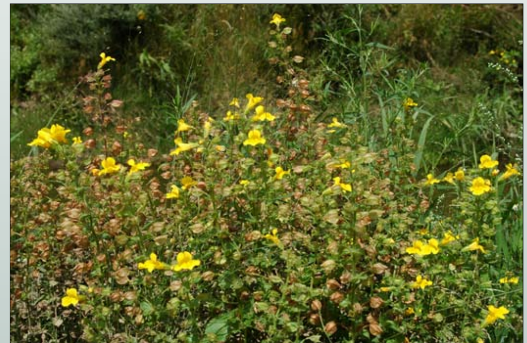
Fot. 37. Zbiorowisko z udziałem kroplika żółtego na brzegach Nysy Kłodzkiej w Przylęku