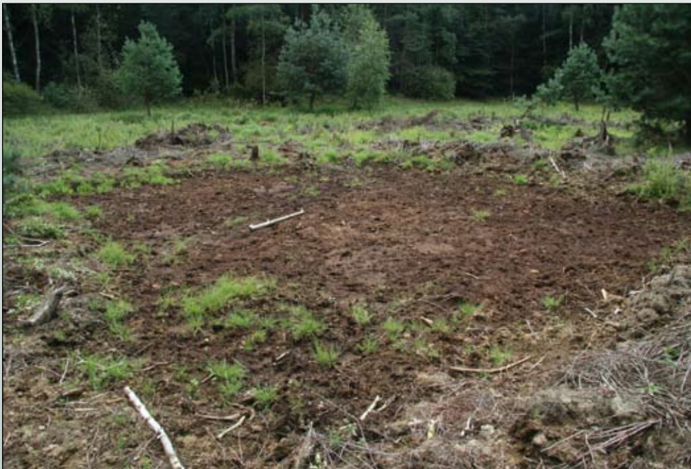
Fot. 106. Powierzchnia po usunięciu 10 cm murszu w rok po zabiegu

podczas zabiegu. Skuteczność zabiegu w takich warunkach limitowana jest jakością wyszukania osobników, w tym młodych. Jakość ta nigdy nie jest stuprocentowa: wyszukiwanie i wyrwanie należy więc powtarzać przez kilka lat.