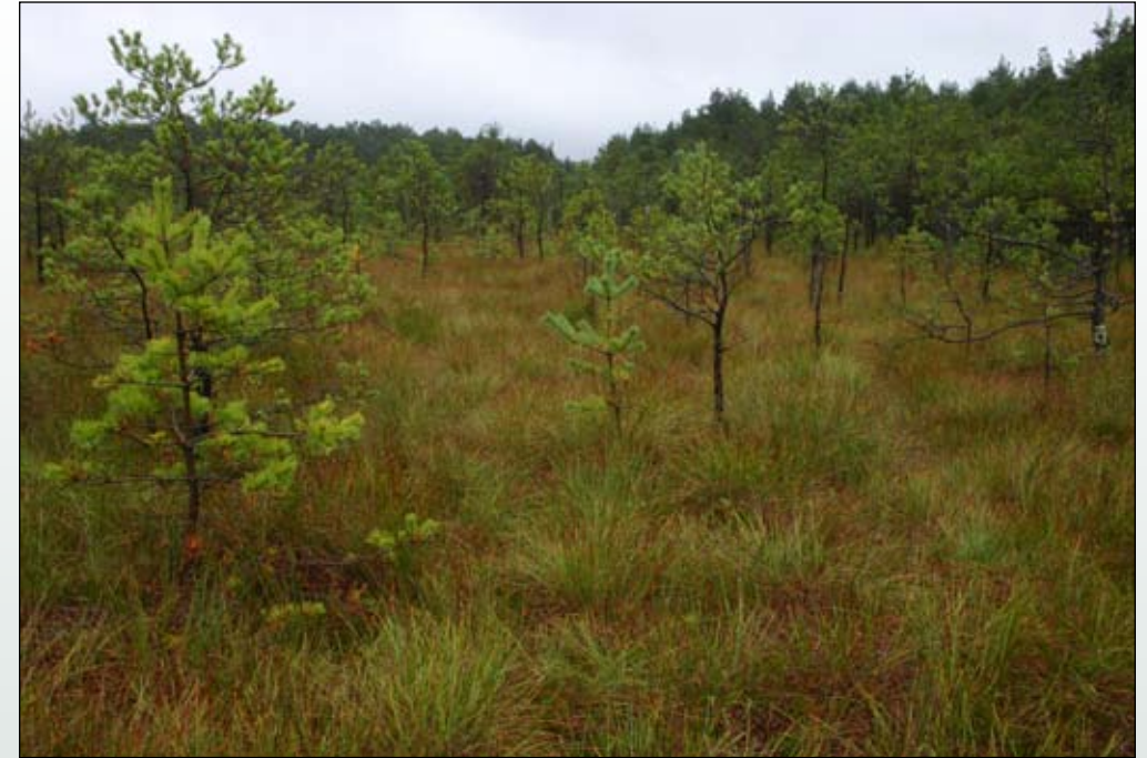
Fot. 4. Dobrze zachowane torfowisko wysokie - ekosystem dość odporny na inwazję gatunków obcych.