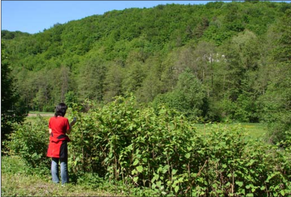
Fot. 64. Rdestowiec ostrokończysty w dolinie Prądnika, przy granicy Ojcowskiego Parku Narodowego