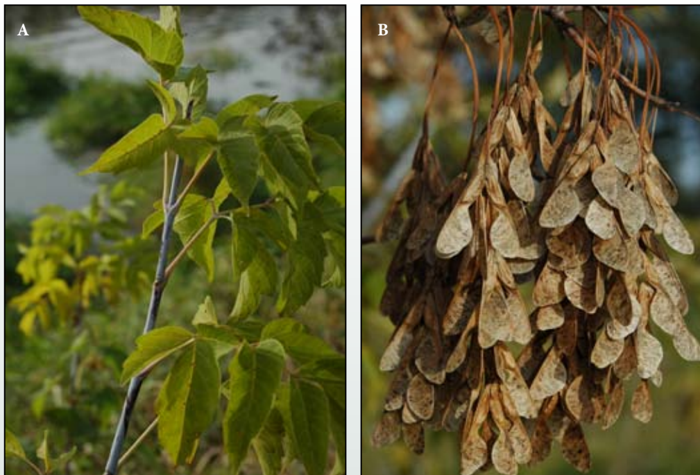
Fot. 83. Klon jesionolistny Acer negundo : A – młode pędy pokryte woskowym nalotem, B – owoce (skrzydlaki)