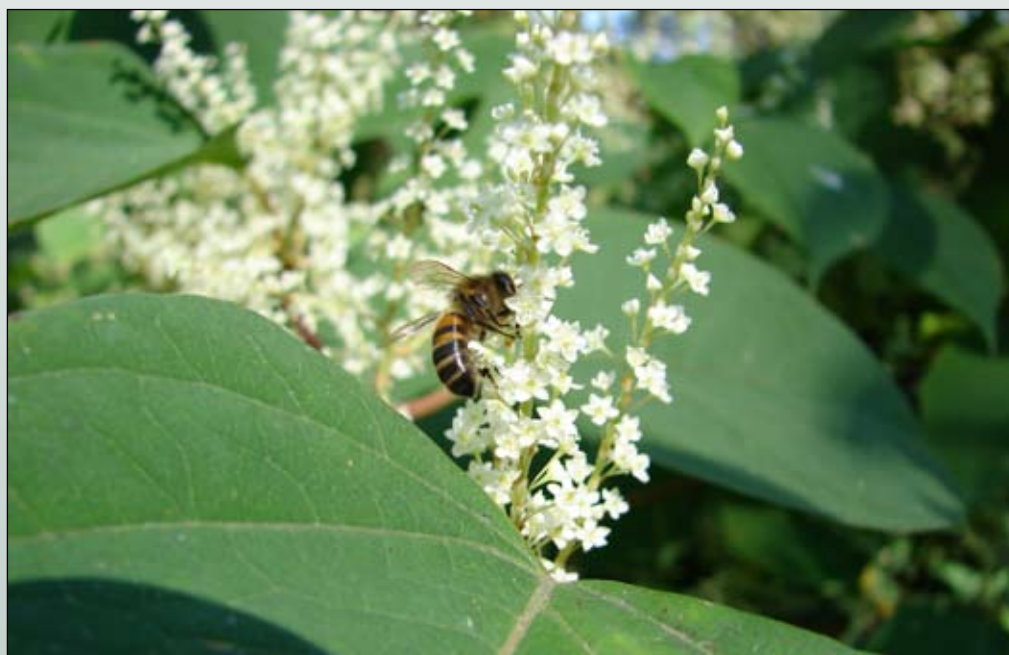
Fot. 60. Kwiaty rdestowca ostrokończystego są chętnie odwiedzane przez owady