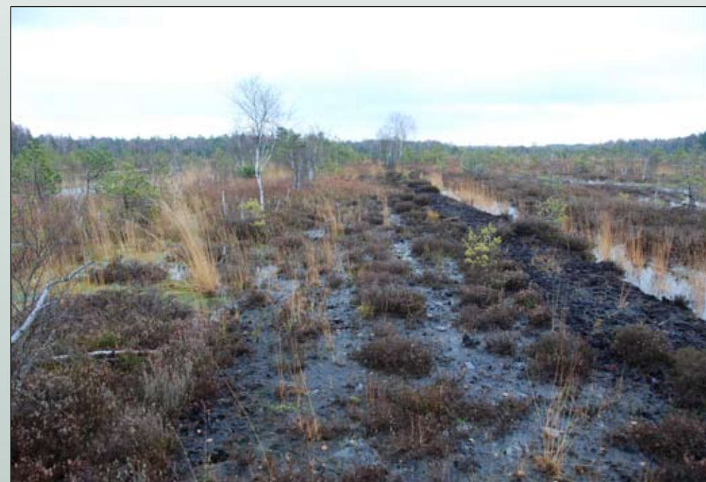
Fot. 81. Ta sama powierzchnia, widok z 2009 r.