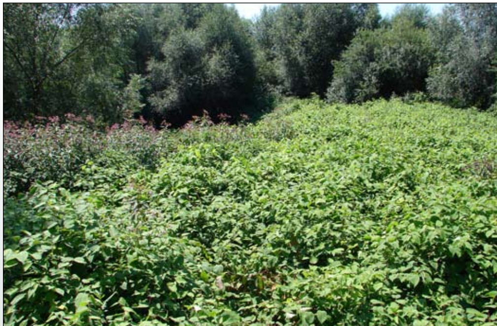
Fot. 95. Regeneracja roślinności na powierzchniach po zastosowanej mieszanej metodzie zwalczania. Nadal dominuje rdestowiec