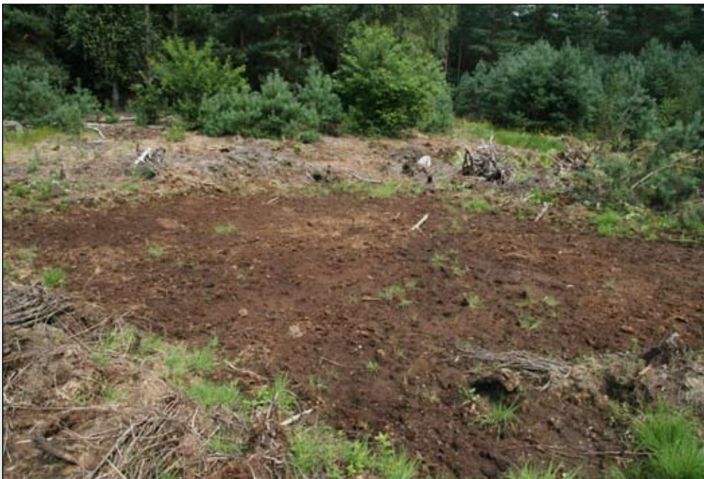
Fot. 107. Powierzchnia po usunięciu 20 cm murszu w rok po zabiegu