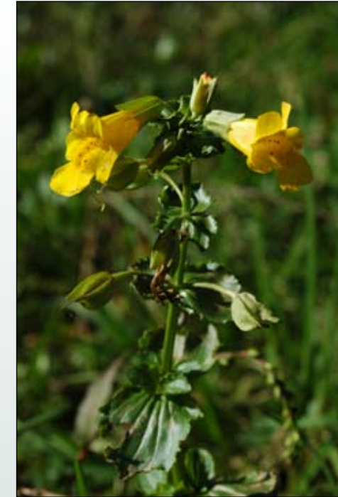
Fot. 36. Pokrój kroplika żółtego Mimulus guttatus

Rejony występowania: Obecnie, odnotowane w Polsce stanowiska kroplika żółtego koncentrują się przede wszystkim na terenie Pomorza Zachodniego i Dolnego Śląska. Pojedyncze stanowiska są znane także z Lubelszczyzny, Warmii, Wielkopolski i Ziemi Lubuskiej (Piękoś 1972; Tokarska-Gu-