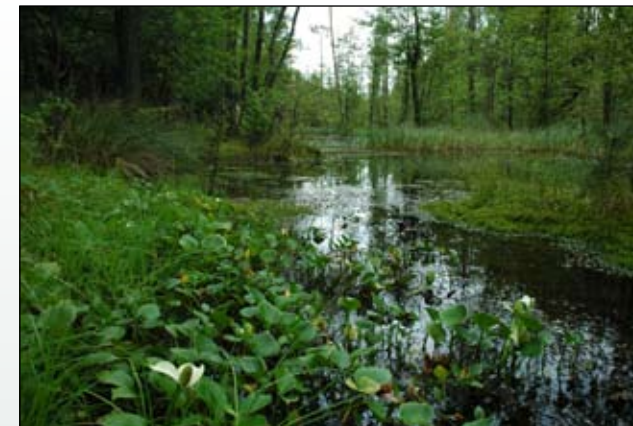
Fot. 9. Starorzecze Nysy Łużyckiej na pograniczu woj. dolnośląskiego i lubuskiego – element dobrze zachowanego odcinka doliny rzecznej

Z drugiej strony możemy mówić o swoistych rysach we florach obszarów górskich w Polsce, wywołanych obecnością neofitów. W Bieszczadach są to nowsi przybysze wkraczający do zbiorowisk naturalnych: rukiewnik wschodni Bunias orientalis spotykany na przydrożach, aluwium, siedliskach antropogenicznych i przechodzący na siedliska naturalne (do wysokości 630-740 m n.p.m.); Juncus tenuis rozprzestrzeniający się wzdłuż ścieżek do wysokości: 630-900 m n.p.m.,