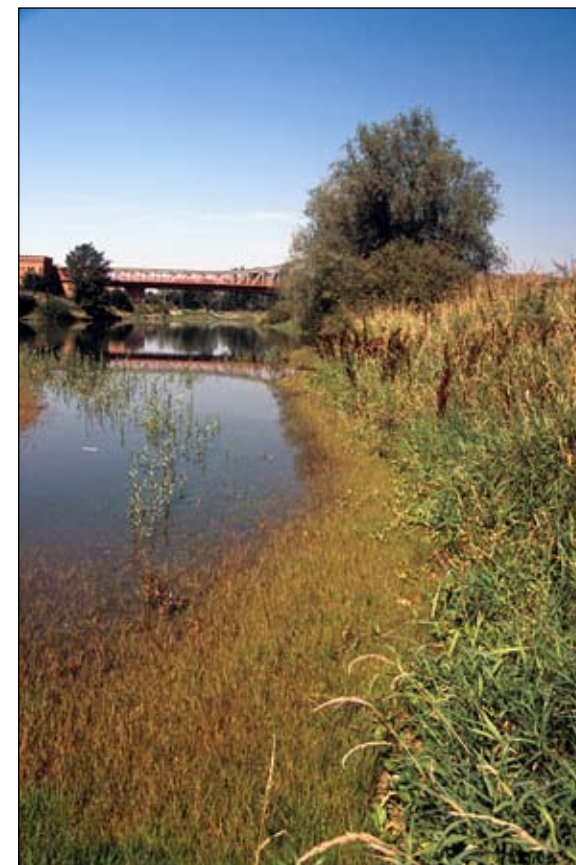
Fot. 51. Zbiorowiska miłki połabskiej na pokrytych żyznym namulem piaszczystym brzegu Odry, w porcie w Ścinawie

Zajmowane biotopy: Zarówno miłka połabska, jak też wieloładogowa na siedliskach wilgotnych rozprzestrzeniają się przede wszystkim w zbiorowiskach z klasy Bidentetea oraz wchodzi w skład roślinności namuliskowej z klasy Isoëto-Nanojuncetea (Krumbiegel 2002; Brandes 2004). Ich udział i pokrycie w płatach są bardzo różne. Spotyka się zarówno płaty zdominowane przez te taksony oraz takie, w których występują z niewielkim pokryciem. Spektrum fitosocjologiczne tych gatunków jest bardzo szerokie. E. multicaulis i E. albensis obserwowane były w płatach Xanthio-Chenopodietum i Chenopodietum glauco-rubri , Polygono-Bidentetum , Leersietum oraz w zbiorowiskach Limosella aquatica i Cyperus fuscus . Niejednokrotnie tworzą własne zbiorowiska z niewielką liczbą gatunków towarzyszących (Kącki 2004, mat. npbl.).