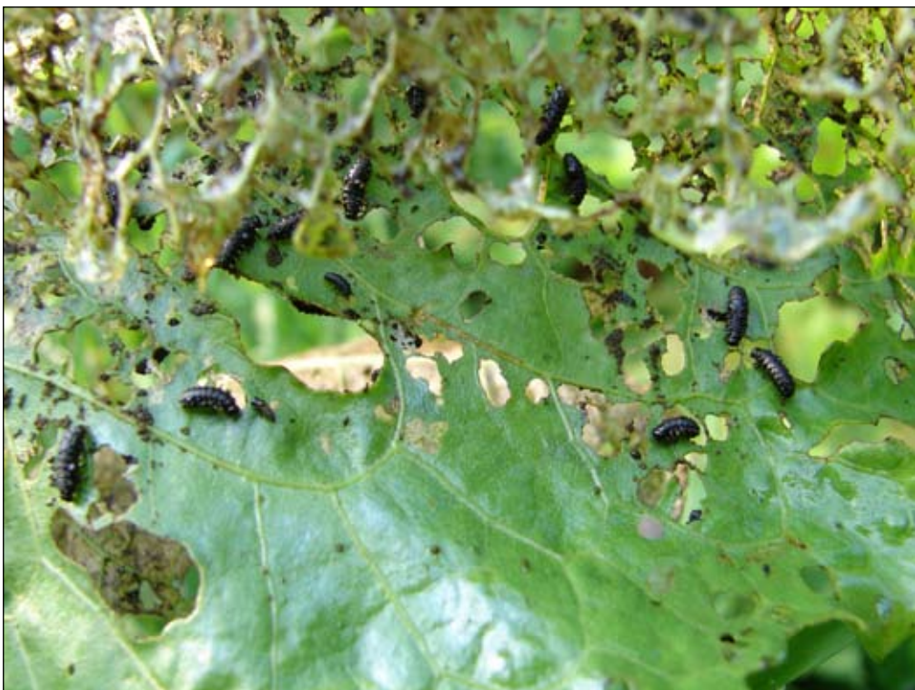
Fot. 93. Larwy owadów żerujące na liściach szczawiu omszonego

Zwolenników zyskują metody biologiczne, będące w wielu przypadkach, bardziej skuteczne i tańsze (Luken i Thieret 1997; Cronk i Fuller 2001; Pimental 2002). Polegają one na zastosowaniu odpowiednio dobranej roślinożercy - optymalnie monofaga lub patogenu. Tradycyjną metodą, znajdującą zastosowanie w przypadku niektórych gatunków, jest wypas. Zazwyczaj ogranicza on rozprzestrzenianie się rośliny, nie eliminując jej jednak całkowicie. Większość gatunków ma w granicach naturalnego zasięgu swoich wrogów: patogeny grzybowe oraz wiele gatunków owadów żerujących na różnych częściach rośliny (Fot. 93, por. także rozdziały charakteryzujące poszczególne gatunki). Zastosowanie biologicznych metod ograniczania rozprzestrzeniania się gatunków inwazyjnych, zdaniem wielu autorów jest zasadne, szczególnie na obszarach takich jak: tereny chronione i rekreacyjne oraz w pobliżu wód. Krytycznym aspektem tej metody jest konieczność wyselekcjonowania właściwego (specyficznego) organizmu kontrolującego inwazję danego gatunku rośliny, który jednocześnie nie stanie się zagrożeniem dla innych składników flory (Tokarska-Guzik 2009). Badania takie trwają zwykle kilka lat i rozpoczynają się w granicach naturalnego zasięgu problemowego gatunku inwazyjnego. Wymagają