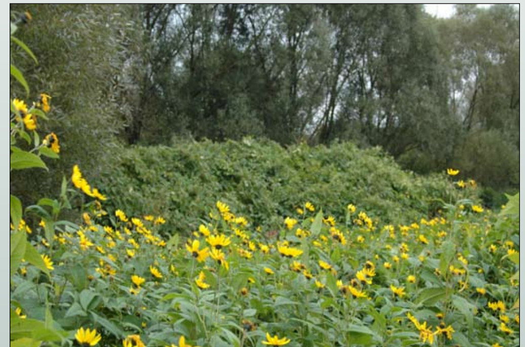
Fot. 70. Zbiorowiska z dominacją słonecznika bulwiastego na brzegach Odry w rejonie Chałupek, na drugim planie zarośla rdestowców