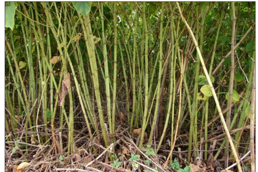
Fot. 63 Rdestowe tworzą zwarte i często jednogatunkowe fitocenozy (Fot. B. Tokarska-Guzik)

W środowisku miejskim mogą stanowić atrakcyjny element dekoracyjny, często osłaniając i podnosząc walor estetyczny gruzowisk, wysypisk i różnego rodzaju nieużytków. Ze względu na szybki wzrost i małe wymagania siedliskowe mogą być wykorzystywane do kształtowania ekranów dźwiękochłonnych. Skupienia i łany rdestowca są miejscem schronienia wielu gatunków bezkręgowców, ptaków i drobnych gryzoni. Jako rośliny późno kwitnące stanowią też źródło nektaru dla wielu gatunków owadów. Zatem, obok licznych głosów postulujących konieczność zwalczania lub przynajmniej ograniczenia dalszego ich rozprzestrzeniania się, pojawiają się także opinie ekologów podkreślające pozytywną rolę, jaką mogą pełnić w ekosystemach miejskich. Jednak i tu bywają przyczyną konkretnych zagrożeń: opanowując brzegi dróg i linii kolejowych, ograniczają widoczność; wyrastając nawet na miejscach pokrytych asfaltem czy betonowymi płytami, przyczyniają się do niszczenia nawierzchni. W wielu przypadkach, ze względu na wyjątkową żywotność (Fot. 65) i możliwości regeneracyjne, obniżają potencjalne możliwości zagospodarowania obszarów (przede wszystkim R. japonica i mieszaniec).