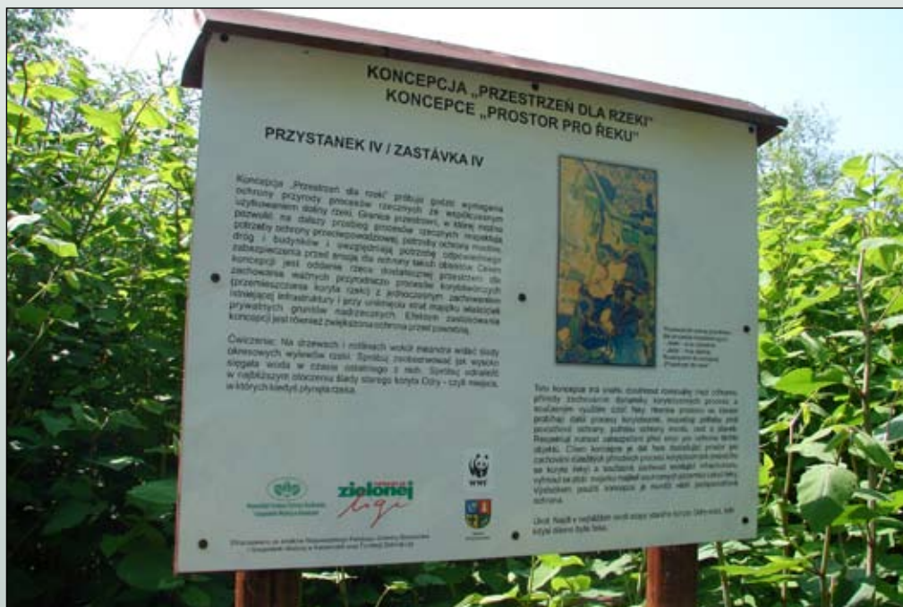
Fot. 96. Tablica informacyjna na trasie ścieżki dydaktycznej na terenie „Granicznego Meandra Odry”

l/ha i 8 l/ha. Użyty herbicyd zawiera w swoim składzie jedną z najskuteczniejszych substancjami chemicznymi w zwalczaniu niepożądanych chwastów – glifosat. Związek ten, o charakterze nieselektywnym, dopuszczony jest do stosowania w pobliżu wód również w Polsce. Na jego użycie otrzymano zgodę Wojewódzkiego Konserwatora Przyrody. W tych częściach obszaru, gdzie stosowanie jakichkolwiek środków chemicznych nie jest wskazane, ograniczono się do wykorzystania jedynie metody mechanicznej (Tokarska-Guzik 2006; Tokarska-Guzik i in. 2007).