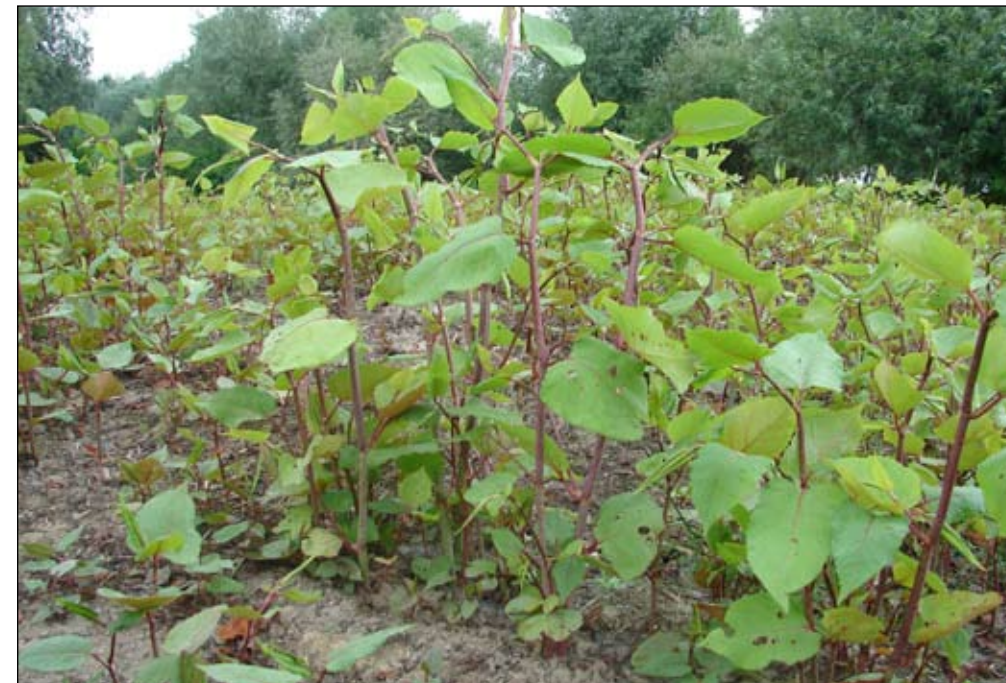
Fot. 3. Zwalczanie inwazyjnych gatunków obcych jest niełatwe! Rdestowce ( Reynoutria ) regenerujące się po próbach ich zwalczania.

Truizmem jest, że tak rozumiane mokradła mają kluczową rolę dla zachowania różnorodności biologicznej. Jeśli przeanalizujemy różne, tworzone od kilkadziesiąt lat, czerwone listy ginących gatunków roślin lub zwierząt, to zauważymy, że dominują na nich właśnie gatunki związane z siedliskami mokradłowymi. Ponad połowa gatunków kręgowców uznanych za zagrożone i ginące, zamieszczonych w „Polskiej Czerwonej Księdze Zwierząt”, jest bezpośrednio lub pośrednio związana z mokradłami. Gatunki roślin związane z mokradłowymi siedliskami skrajnymi stanowią ponad 50% gatunków roślin uwzględnionych na Czerwonych Listach i objętych w Polsce ochroną prawną. Podobnie zdominowane przez rośliny i zwierzęta wodno-błotne są wykazy gatunków uznanych za zagrożone, będące załącznikami do dyrektyw Unii Europejskiej o ochronie siedlisk, czy choćby listy gatunków chronionych w różnych krajach. Fakt znalezienia się licznej grupy gatunków mokradłowych na wymienionych listach świadczy oczywiście o stopniu degradacji i zagrożenia ich siedlisk, jednocześnie jednak wskazuje na