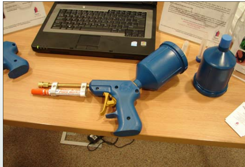
Fot. 91. Sprzęt do nastrzykiwania pędów. Zalety metody to wprowadzenie odpowiedniej dawki i eliminacja wyłącznie rośliny zwalczanej, wada - zabieg czasochłonny