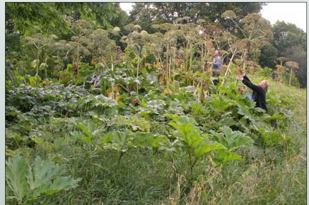
Fot. 98. Ograniczanie rozsiewania się nasion poprzez zakładanie plastikowych worków na kwiatostany barszczu Sosnowskiego jest trudne ze względu na rozmiary tych roślin