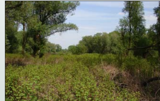
Fot. 13. Fragment siedliska lasu łęgowego