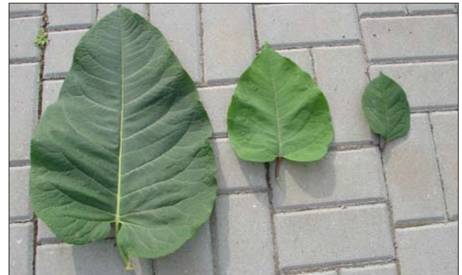
Fot. 56. Porównanie wielkości i kształtu liści trzech rdestowców występujących w Polsce – od lewej liść rdestowca sachalińskiego, pośredniego i ostrokończystego

W Polsce, podobnie jak i w pozostałych rejonach Europy Środkowej, występują obecnie dwa gatunki: rdestowiec ostrokończysty Reynoutria ( Fallopia ) japonica i rdestowiec sachaliński Reynoutria ( Fallopia ) sachalinensis oraz - opisany w latach 80. XX w. - mieszańiec między tymi gatunkami: rdestowiec pośredni R. ×bohemica (Fot. 56).