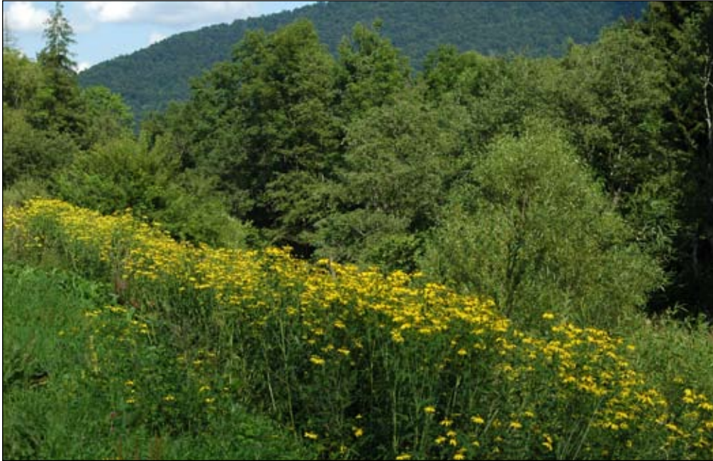
Fot. 44. Ziolorośla z udziałem rudbekii nagiej nad Solinką w okolicach Cisnej

Zajmowane biotopy: W Europie roślina ta jest związana z obrzeżami rzek, strumieni i potoków (Török i in. 2003; Tokarska-Guzik i Dajdok 2004; Walter i in. 2005). Spotykana jest także na siedliskach ruderalnych lub na poboczach dróg (Wróbel 2006). Lokalnie jej skupiska i miejsca ekspansji znajdują się także na groblach wokół stawów. Jednak najczęściej występuje na obrzeżach rowów melioracyjnych i koryt rzecznych (Tokarska-Guzik i Dajdok 2004). Niekiedy na terasach zalewowych wchodzi na obrzeża łąk i lasów łęgowych. W klasyfikacji fitosocjologicznej rudbekia naga jest składnikiem zespołu roślin ziolorośli nadrzecznych z udziałem antropofitów z rodzaju nawłóć Solidago i jest jednym z gatunków charakterystycznych zespołu Rudbeckio-Solidaginetum (Barkman 1989; Matuszkewicz 2001). Jednak nawłocie i rudbekia rzadko występują w płatach wspólnie.