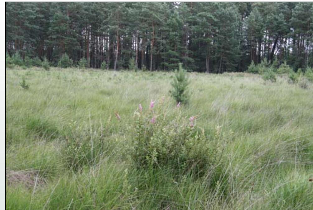
Fot. 72. Pierwsza faza ekspansji – tawuła wkraczająca na zdegradowane wskutek prób zalesienia torfowisko w Borach Dolnośląskich

W Puszczy Drawskiej tawuła kutnerowata występuje na torfowiskach (Fot. 76, 77), zwłaszcza przesuszonych, często zarastając całą powierzchnię. Szczególnie intensywnie wkracza na torfowiska charakteryzujące się zaburzeniami stosunków wodnych. Obecność tego gatunku prowadzi do dalszej degradacji siedliska, przejawiającej się m.in. przyspieszonym procesem murszenia (przesuszenia i mineralizacji) torfu. W Puszczy Drawskiej zaobserwowano, że torfowiska na których stwierdzono obecność tawuły kutnerowatej charakteryzują się silnie zaawansowanym procesem murszenia, a poziom humotorfu wynosi średnio 20 cm. Na właściwie uwil-