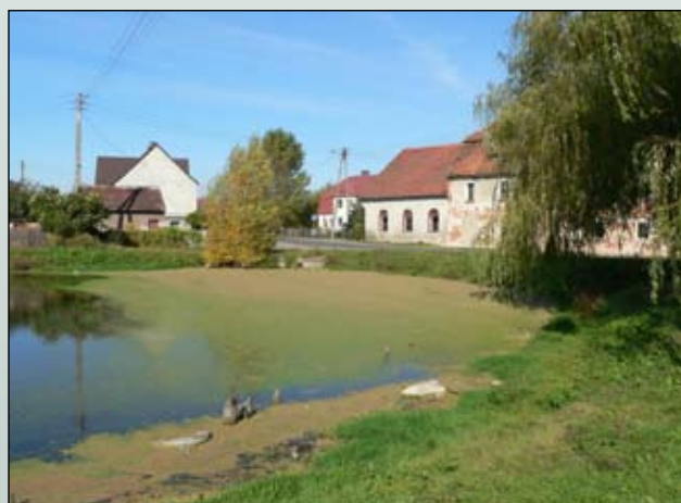
Fot. 19. Azolla paprotkowa Azolla filiculoides na stanowisku w Wilkszynie: 1. październik 2007, 2. listopad 2007 (po oczyszczeniu zbiornika), 3. wrzesień 2008 (odtworząca się populacja)

Oddziaływanie na rodzime gatunki: Dzięki bardzo dużej żywotności i tempie namnażania pod koniec lata azolla tworzy praktycznie jednogatunkowe agregacje. Mata azollowa, osiagająca w Polsce grubość nieco ponad 10 cm, powoduje odcinanie dopływu światła do zbiornika, brak mieszania wody, spadek poziomu tlenu i eutrofizację wody. Ponadto eliminuje rodzime gatunki pleustonowe i doprowadza do ujednolicenia roślinności pływającej. Wszystko to powoduje spadek bioróżnorodności zbiornika. Obserwowano, że pod matą azolli zachodzi zamieranie zanurzonych roślin i glonów (Janes i in. 1996) oraz zmniejszanie populacji ryb (Gartwicke i Marshall 2001). W szczególnych przypadkach w sztucznych zbiornikach w obrębie obszarów zabudowanych, gdzie nie wykształca się pełny łańcuch pokarmowy, mata azolli może dawać skutki korzystne – odpowiednio gruba nie dopuszcza do rozwoju larw komarów.