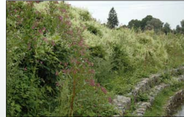
Fot. 12. Brzegi rzek silnie zmienione w wyniku ich umacniania są szczególnie narażone na masowy rozwój gatunków inwazyjnych – na zdjęciu Lubatówka przy jej ujściu do Wisłoka w Krośnie

Z punktu widzenia ochrony przyrody bardzo istotne wydają się wyniki badań wskazujące, że najprawdopodobniej we wszystkich europejskich ekosystemach może dochodzić do inwazji, ale (co ważniejsze) im bardziej dany ekosystem jest narażony na antropopresję tym prawdopodobieństwo, że dojdzie w jego obrębie do inwazji jest większe (Hulme 2007). W odniesieniu do dolin rzecznych oznacza to, że na odcinkach znaczenie przekształconych przez człowieka liczba stanowisk gatunków obcych jest większa niż na odcinkach przebiegających przez obszary zmienione w niewielkim stopniu. W naszych warunkach potwierdzają to m.in. obserwacje z doliny Odry (Kącki i Dajdok 2003), Soły, Wapienicy i Jasieniczanki (Tokarska-Guzik i in. 2006) czy też