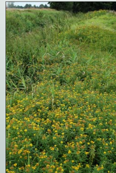
Fot. 55. Zbiorowiska z udziałem nawłoci trawolistnej – Niemodlin woj. opolskie