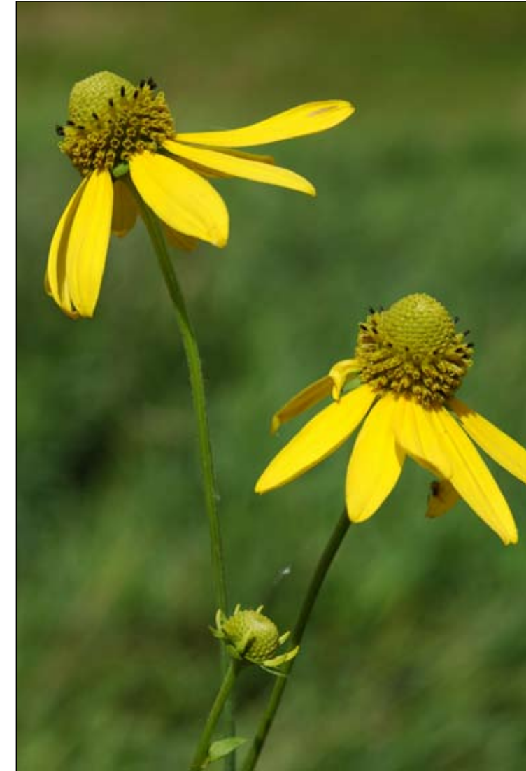
Fot. 43. Pokrój kwiatostanów (koszyczków) Rudbeckii nagej Rudbeckia laciniata

Czas i droga zawleczenia: W Europie Rudbeckia naga po raz pierwszy odnotowana była w uprawie ogrodowej w 1615 roku (Jalas 1993). Natomiast pierwsza obserwacja tego gatunku poza uprawą pochodzi dopiero z końca XVII w. z terenu Dolnego Śląska (Fiek 1881). Gatunek ten poszerzał zajmowany obszar wyraźnie koncentrując stanowiska wokół miejsc pierwszej kolonizacji środowiska naturalnego, by po około 100 latach zasiedlić większą część dolin rzecznych Dolnego Śląska, Opolszczyzny i zachodniej części Górnego Śląska (Tokarska-Guzik, 2005). Obecnie jest również powszechnie spotykany nad potokami południowo-wschodniej części Polski, m.in. w Bieszczadach (Fot. 44). W krótkim czasie zasiedlił terytorium Polski powiększając liczbę stanowisk z 3 znanych w połowie XIX w. do około 2251 w chwili obecnej (Tokarska-Guzik 2005).