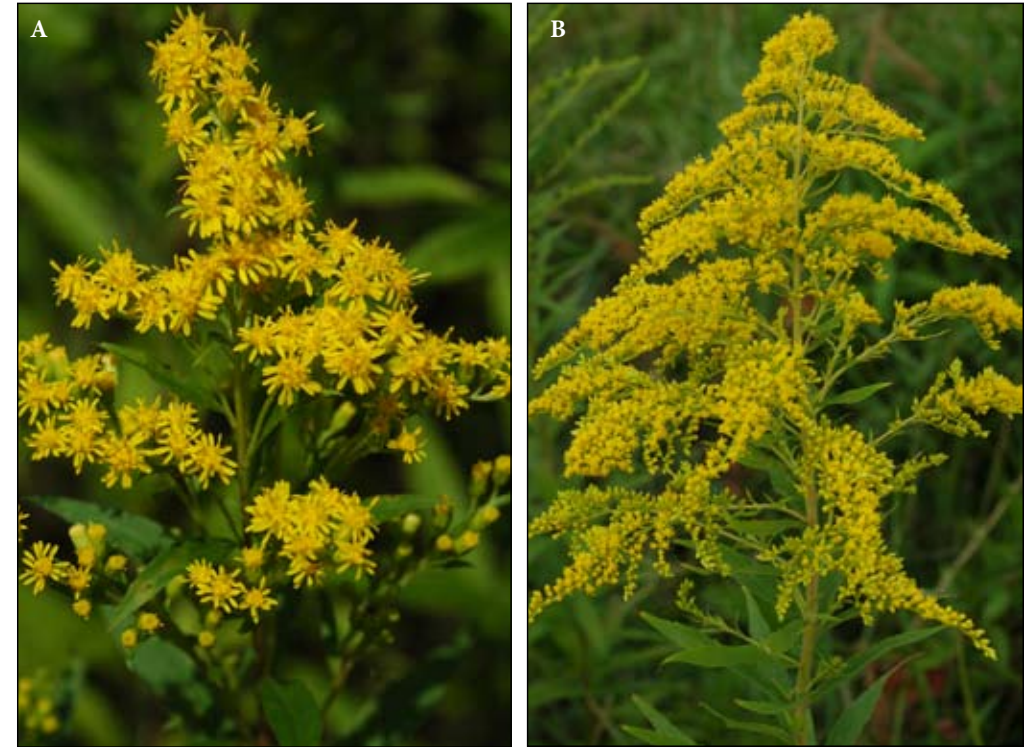
Fot. 52. Kwiatostany nawłóci późnej Solidago gigantea (A) i kanadyjskiej Solidago canadensis (B)

Morfologia i biologia gatunków: Nawłóć późna osiąga wysokość 80-200 (230) cm. Łodygę ma prostą, w zarysie okrągłą i pełną, pozbawioną owłosienia oraz delikatnie rowkowaną. Liście są naprzemianległe, gęsto osadzone, lancetowate, od 7 do 18 cm długie i od 1,2 do 3 cm szerokie. Są zaostrome i jedynie na nerwach spodniej strony delikatnie owłosione. Brzeg liścia jest piłkowany o ząbkach skierowanych w górę blaszki. Kwiatostany są wiechowate, sprawiające wrażenie jednostronnych 10-20 cm długie, a w czasie owocowania dorastają nawet do 40 cm (Fot 52). Okrywa koszyczka jest złożona z 13-16 wąskich, spiczastych, żółtozielonych liści z wyraźną środkową żyłką. Korona kwiatów rurkowatych jest żółta. Drobne owoce są zaopatrzone w aparat lotny. Nawłóć późna kwitnie od sierpnia do września (Rutkowski 1998; Slavik 2004).