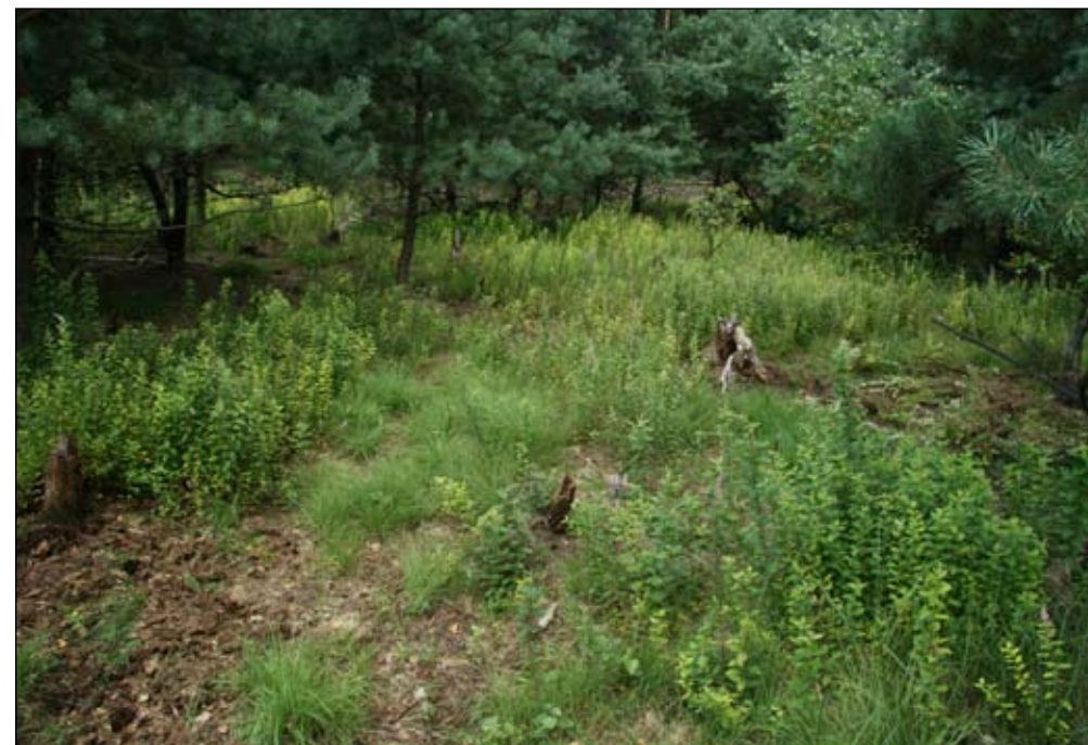
Fot. 102. Zarośla tawuły na torfowisku

Torfowisko Osowiec (nadleśnictwo Głusko, gmina Dobiegniew) to utworzony w 2004 r. rezerwat przyrody. Jest to dawne, złądowaciale jezioro zarośnięte szuwarem kłoci wiechowatej, a od północnej części także unikatowymi mechowiskami z turzycą obłą Carex diandra , unikatowymi mchami: Paludella squarrosa , Scorpidium scorpioides oraz rzadkimi gatunkami torfowców ( Sphagnum contortum , Sphagnum centrale , Sphagnum russowii ). Utworzenie rezerwatu było efektem kilkuletnich starań Klubu Przyrodników. W ramach poprzednich projektów EkoFunduszu zbudowano też (skutecznie funkcjonującą do dziś) zastawkę drewnianą stabilizującą poziom wody. Troszczące się o rezerwat nadleśnictwo zbudowało platformę widokową na torfowisko i ustawiło tablice informacyjne. W 2006 r. wykonano plan ochrony rezerwatu, identyfikując istotne zagrożenie ekspansją tawuły kutnerowatej oraz potrzebę pilnego wykonania zabiegów ochronnych (usunięcie tawuły, a także wykaszanie zarastającej torfowisko trzciny). W samym rezerwacie występowały rozproszone, pojedyncze osobniki tawuły na torfowisku i jego obrzeżach, jednak w otulinie rezerwatu znajdowało się kilka małych torfowisk topogenicznych całkowicie zarośniętych przez tawułę (Fot. 102). Kontrole tych populacji uznano za konieczną, by zmniejszyć ryzyko inwazji gatunku na główne torfowisko, chronione w rezerwacie.