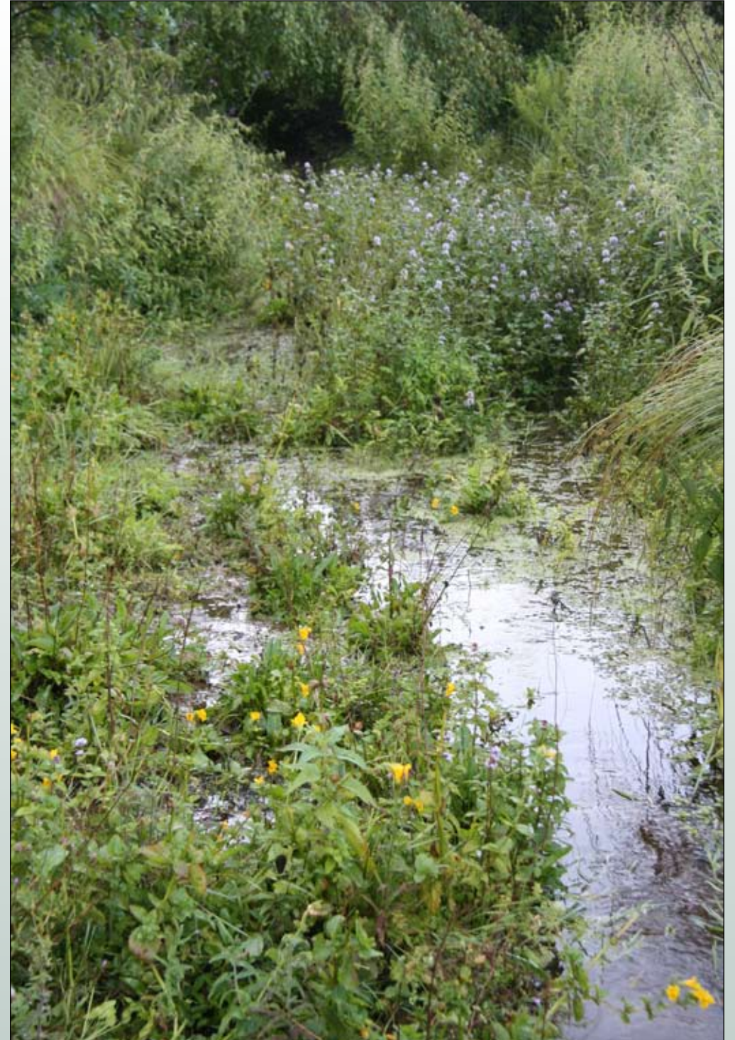
Fot. 8. Kroplik żółty Mimulus guttatus w rowie na torfowisku źródłiskowym