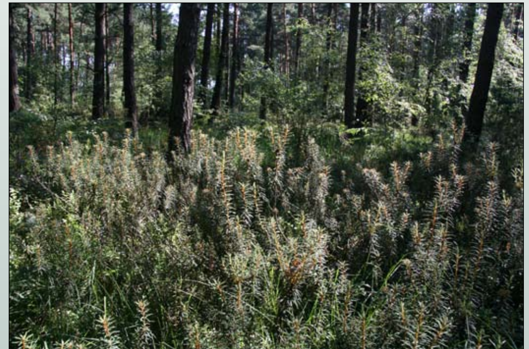
Fot. 5. Dobrze zachowany bór bagienny na torfie w Borach Dolnośląskich – ekosystem dość odporny na inwazję gatunków obcych