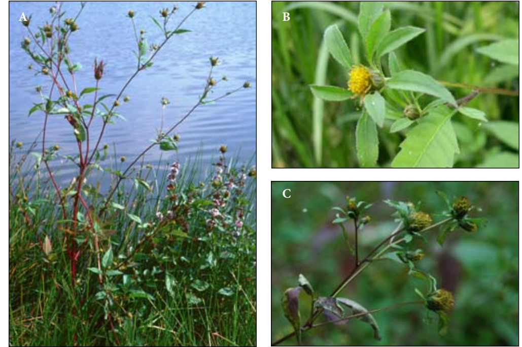
Fot. 32. Uczep amerykański Bidens frondosa : A – pokrój rośliny (Fot. B. Tokarska-Guzik); B – pojedynczy koszyczek (Fot. A. Urbisz); C – pokrój szczytowej części rośliny (Fot. Z. Dajdok)

Czas i droga zawleczenia: Do Europy sprowadzony prawdopodobnie do Ogródów Botanicznych. Po raz pierwszy gatunek ten odnotowano w Europie Środkowej w 1736 (Lohmeyer i Sukopp 1992; Tokarska-Guzik 2005). Następnie został podany, jako zdziczały z Ogródu Botanicznego w Montpellier w 1762 roku (Thellung 1912; Schumacher 1941; Trzcińska 1961). Pierwsze stanowiska Bidens frondosa podano z Włoch - 1834, 1849, 1861, Portugalii - 1877 i Niemiec - 1894, skąd prawdopodobnie rozprzestrzenił się po Europie (Kornaś i in. 1959; Trzcińska 1961; Tokarska-Guzik 2005). Na teren Polski, gatunek ten prawdopodobnie został zawleczony z Niemiec. Pierwsze stanowiska tej rośliny odnotowano nad Odrą: w 1777 roku we Wrocławiu Szczytnikach (Krocker 1790; Tokarska-Guzik 2005), w 1896 w Słubicach (Schumacher 1942; Trzcińska 1961; Tokarska-Guzik 2005), w 1898 w okolicach Głogowa (Fiek i Schube 1898) oraz nad Wisłą koło Elbląga (Graebner 1897) i Ciechocinka (Ascherschon 1898). Gatunek ten rozprzestrzenił się wzdłuż głównych rzek i ich dopływów, a następnie jako antropochor wzdłuż linii kolejowych (Kornaś i in. 1959; Kornaś 1960), rozszerzając areał występowania ku południowi i wschodowi (Tokarska-Guzik 2005).