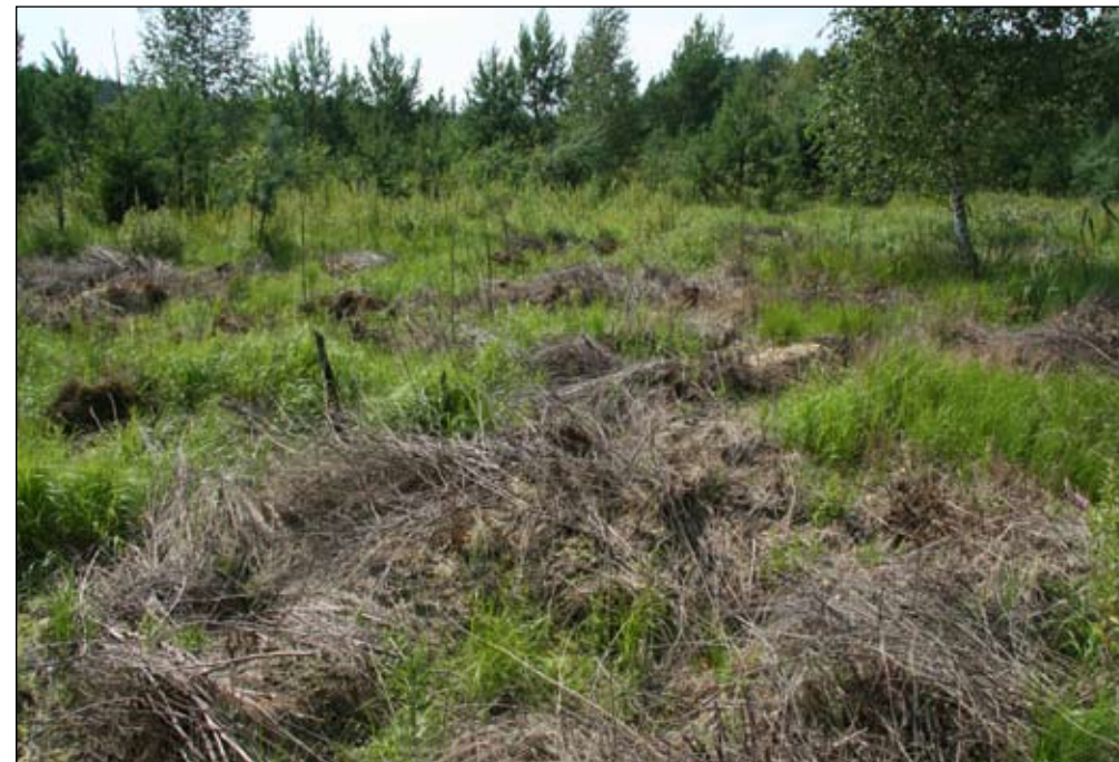
Fot. 109. Skutki eksperymentalnego zwalczania chemicznego w luźnych zaroślach tawuły. Stan rok po zabiegu

neracji zarośli po zabiegu. Skuteczność zabiegu jest ograniczana tylko przez trudność zaaplikowania herbicydu na wszystkie pędy (starano się unikać opryskiwania czegokolwiek innego niż pędy tawuły). Wydaje się, że najskuteczniejszą metodą walki z tawułą kutnerowatą byłby wiosenny oprysk herbicydem, następnie wycięcie suchych pędów (odsłania to podstawę krzewu i czyni dostęp do ewentualnie żywych pędów), a następnie powtórzenie oprysku jesienią, bądź wiosną kolejnego roku. Jako alternatywę dla oprysku, należałoby w przyszłości rozważyć zastosowanie mazaczy herbicydowych.