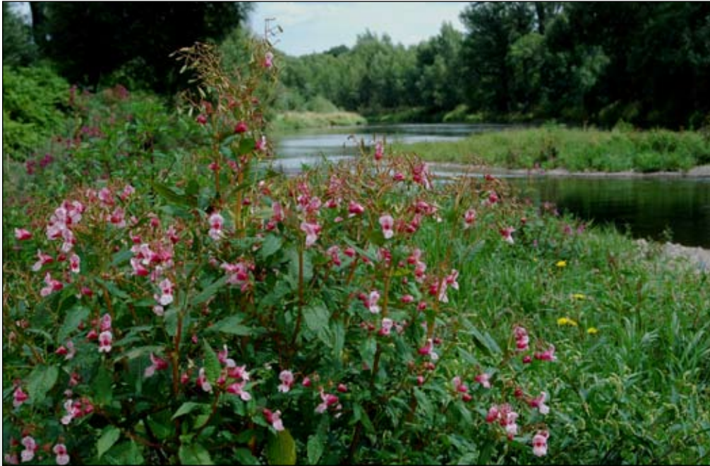
Fot. 26. Niecierpek gruczołowaty na brzegu Nysy Kłodzkiej w Przyłęku, poniżej Barda Śląskiego