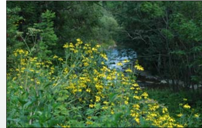
Fot. 15. W Bieszczadach jednym z najczęściej spotykanych gatunków obcego pochodzenia jest rudbekia naga opanowująca ziołorośla nadrzeczne – na zdjęciu fragment doliny Solinki