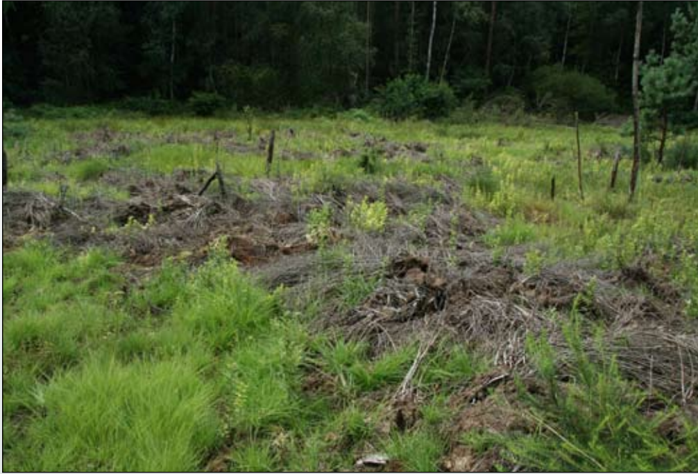
Fot. 105. Odrastanie tawuły w rok po jej wyrwaniu