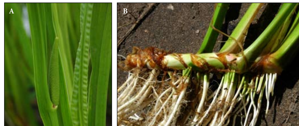
Fot. 47. Tatarak zwyczajny Acorus calamus : fragment pędu z widocznym kwiatostanem typu kolby (A) fragment kłącza (B)

Zajmowane biotopy i zagrożenia dla ekosystemów: Tatarak zwyczajny jest typowym makrohydrofitem, preferuje podłoża szlamiste zmineralizowane, także na terenach bagnistych (Pola-kowska 1976) lub słabo zatorfionych (Podbielkowski i Tomaszewicz 1996). Jest rośliną obcego pochodzenia, która zdomowała się w różnego typu zbiorowiskach szuwarowych, tworząc często własne jednogatunkowe agregacje w randze zespołu roślinnego, określanego mianem szuwaru tatarakowego Acoretum calami (Fot. 48). Jest to zbiorowisko ubogie florystycznie, wykształcające się w płytkich zbiornikach wód eutroficznych i mezotroficznych, w miejscach stałego dopływu związków azotowych i fosforowych, stąd wybitnie nitrofilne (Matuszkiewicz 2001). Jest zbiorowiskiem najbardziej odpornym na antropopresję, zwłaszcza na zanieczyszczenia ściekami komunalnymi (Matuszkiewicz 2001). W zbiorowiskach szuwarów właściwych ze związku Phragmition często wypiera i zastępuje na podobnych siedliskach szuwar mannowy Glycerietum maximae , z panującym, rodzimym gatunkiem – manną mielec.