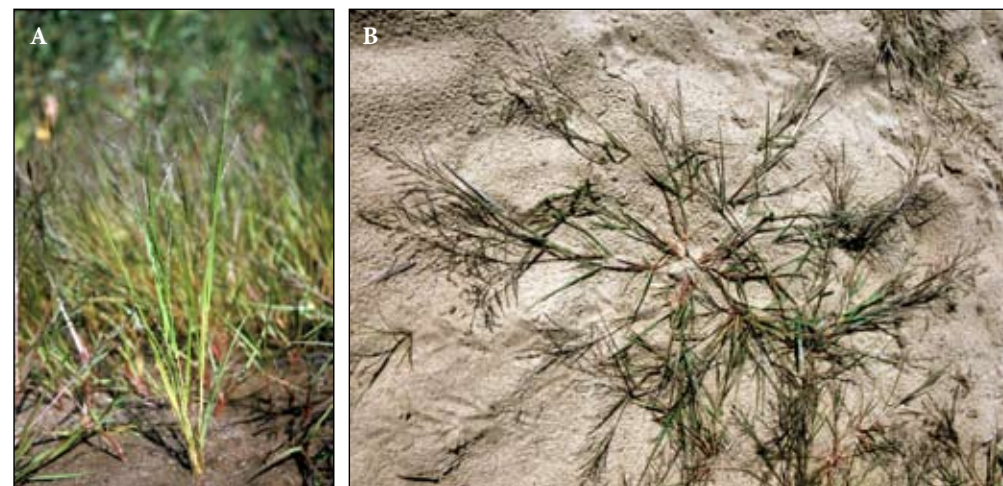
Fot. 50. Pokrój miłki wielołodygowej Eragrostis multicaulis (A) i miłki połabskiej Eragrostis albensis . (B)

Opisywane gatunki są problematyczne pod względem taksonomicznym. Cechy diagnostyczne są słabe, zmienność morfologiczna duża, ponadto wymagania siedliskowe mają zbliżone - szczególnie dotyczy to E. albensis i E. multicaulis . Spośród wymienionych powyżej gatunków na siedliskach mokradłowych, głównie na aluwialnych piaskach, pojawiają się miłka wielołodygowa E. multicaulis i miłka połabska E. albensis . (Fot. 50) Niemal wszystkie okazy zielnikowe E. pilosa znajdujące się w Polskich zbiorach należą do E. albensis , jedynie notowania ze stacji w Pile faktycznie dotyczą tego taksonu i obecnie jest on uważany za efemerofit (Guzik i Sudnik-Wójcikowska 2005). Miłka amurska E. amurensis jest jeszcze taksonem nierozpoznanym w Polsce. Miłka amurska E. minor na siedliskach wilgotnych jest obserwowana jedynie okazjonalnie. Jest to gatunek bardziej ciepło- i sucholubny. W dalszej części pracy trzy ostatnie gatunki pominięto.