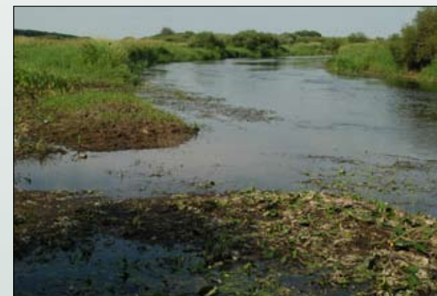
Fot. 10. Biebrza – przykład doliny rzecznej o naturalnym charakterze