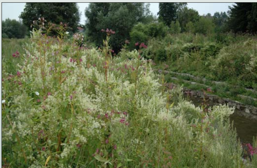
Fot. 24. Zbiorowiska z dominacją kolczurki klapowanej i niecierpka gruczołowatego nad Lubatówką przy jej ujściu do Wisłoka w Krośnice

Zajmowane biotopy: Gatunek ten jest nadal chętnie wysiewany w ogródach przydomowych i na działkach, zwłaszcza przy siatkach ogrodzeniowych, po których łatwo się wspina. W związku z tym jego populacje poza uprawą są nadal zasilane przez okazy rozwijające się z nasion zawleczonych na dzikie składowiska odpadów. Kolczurka klapowana należy do tej grupy gatunków obcych, które najsilniej są związane z brzegami wód. Roślina ta jest składnikiem ziołoroślowych zbiorowisk okrajkowych z klasy Artemisietea (związków Senecion fluviatilis i Convolvulion sepium ) lub wiklin nadrzecznych (zespół Salicetum triandro-viminalis ). Ponadto nad brzegami wód jest spotykana w płatach szuwaru mozgowego Phalaridetum arundinaceae , a na obrzeżach stawów notowano ją z płatów szuwaru mannowego Glycerietum maximae . W ostatnim czasie coraz częściej pojawia się również w zbiorowiskach z klasy Bidentetea wykształcających się na okresowo odsłanianych obrzeżach wód.