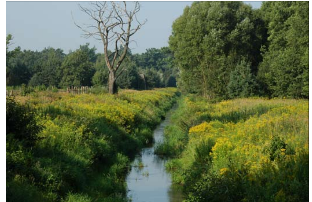
Fot. 53. Opanowane przez nawłóć późną brzegi ciek - Karłowice, woj. opolskie

Działania zaradcze: Aby skutecznie ograniczyć ekspansję nawłóci oraz zmniejszać negatywne skutki ich obecności w środowisku, należy przede wszystkim prowadzić kampanię edukacyjną, w szczególności wśród pszczelarzy i ogrodników. Nawłóć późna podobnie jak nawłóć kanadyjska jest wciąż sadzona jako roślina ozdobna i miododajna (Tokarska-Guzik i Dajdok 2004). Skutecznym sposobem jej eliminacji może być regularne koszenie (kilkakrotnie w ciągu roku) i niedopuszczanie do wzrostu jej udziału w zbiorowisku. W początkowej fazie ekspansji dobre rezultaty daje punktowe niszczenie roślin (wrywanie lub wykopywanie). W przypadku, kiedy celem ochrony na danym obszarze nie są zbiorowiska roślin zielnych, można podejmować działania przyspieszające sukcesję roślin drzewiastych, których zwarcie zwiększa ocienienie i pogorsza warunki siedliskowe nawłóci.