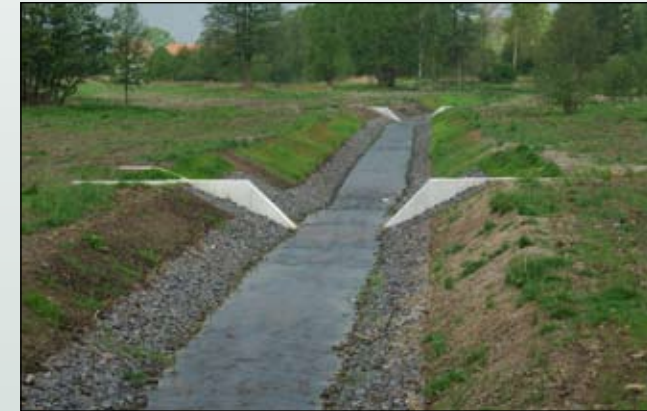
Fot. 16. Drastyczna zmiana charakteru cieków - zniszczenie obudowy roślinnej, likwidacja meandrów i sztuczne formowanie brzegów sprzyja zadomawianiu się roślin synantropijnych, w tym także gatunków obcych geograficznie, na zdjęciu rzeka Bielawka w Dłuzynie Górnej