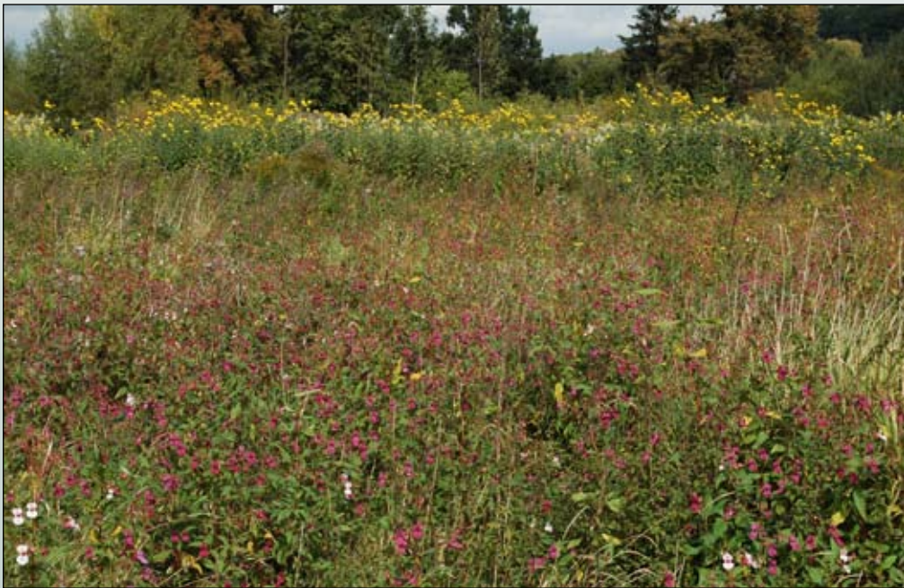
Fot. 27. Fragment dawnej łąki opanowanej przez niecierpka gruczołowatego (na drugim planie słonecznik bulwiasty) na terasie zalewowej Nysy Łużyckiej, na wysokości Koźmina

Skawa (Tokarska-Guzik 2005), a także Bystrzyca, Nysa Kłodzka, czy rzeki Podkarpacia, jak Wisłok i Wisłoka (Dajdok mat. npbl.).