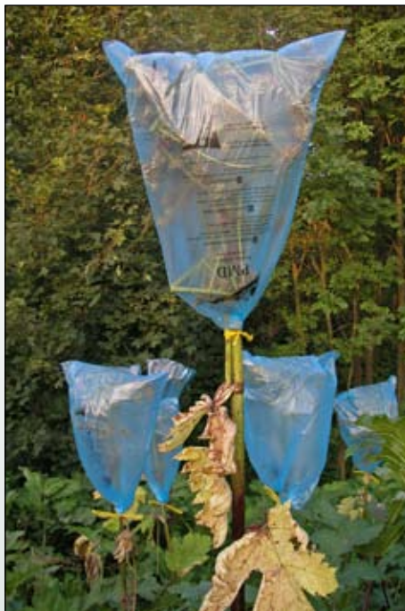
Fot. 99. Plastikowe worki zabezpieczają przed rozsianiem się nasion