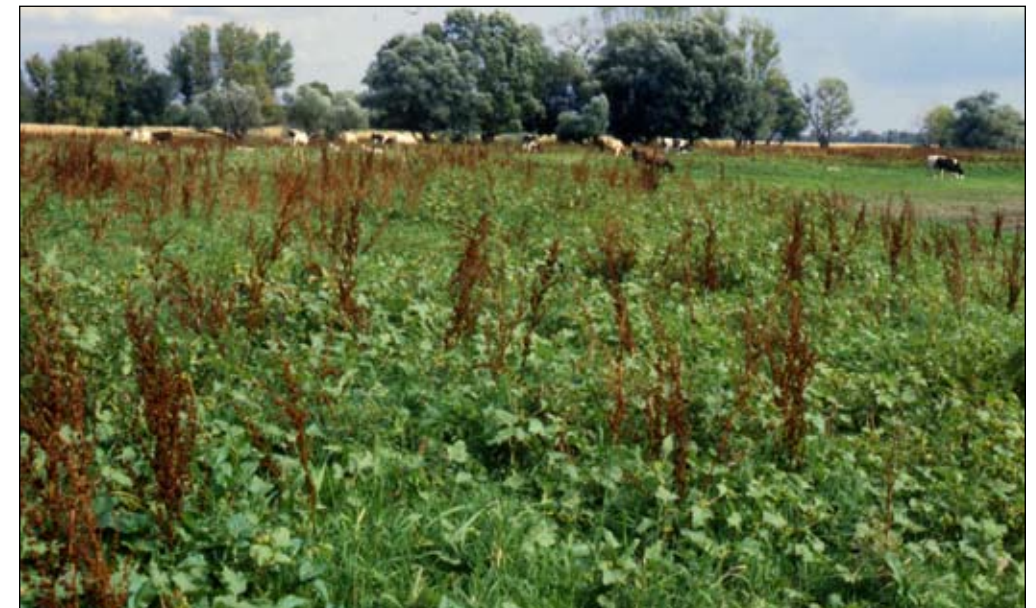
Fot. 31. Fragment pastwiska na terasie zalewowej Odry poniżej ujścia Nysy Łużyckiej