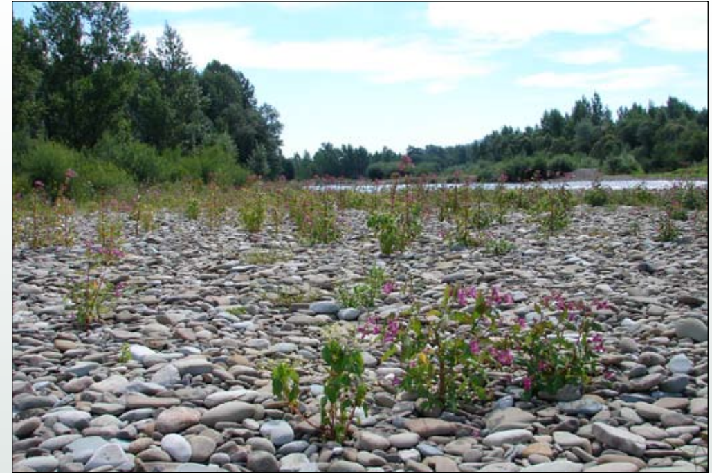
Fot. 1. Niecierpek gruczołowaty ( Impatiens glandulifera ) wkraczający na kamieńce nadrzeczne.