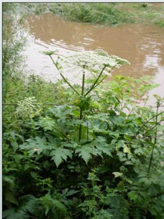
Fot. 35. Barszcz Sosnowskiego na brzegu Nysy Kłodzkiej na wysokości Kamieńca Ząbkowickiego

oddzielnego zespołu Urtico-Heracleetum mantegazziani okazała się nieudana z powodu braku stabilnej kompozycji gatunkowej (Klauck 1988).