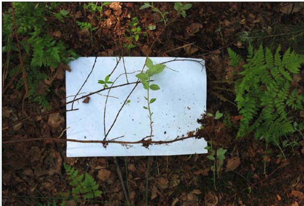
Fot. 103. Rozłogi tawuły – główna przyczyna trudności jej zwalczania