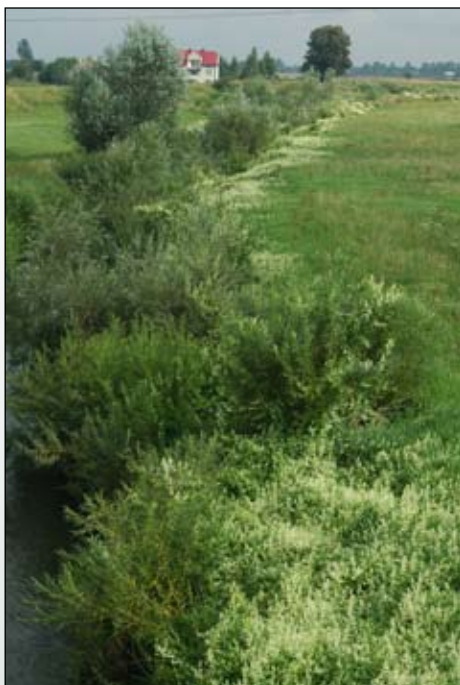
Fot. 23. Zbiorowiska z udziałem kolczurki klapowanej nad Uswicę w okolicy Tarnowa