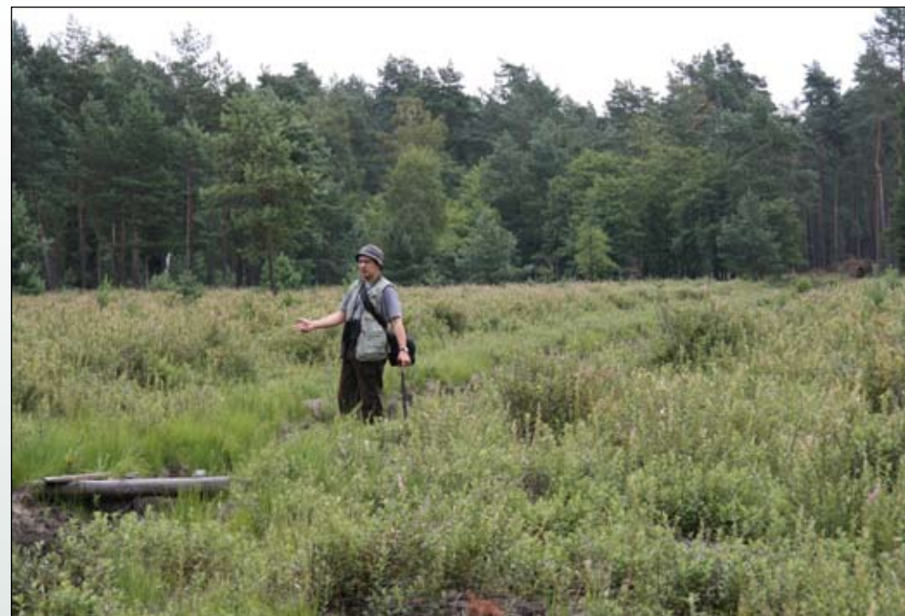
Fot. 74. Zwarty łąn tawuły na torfowisku w Borach Dolnośląskich

Wkraczaniu tawuły na torfowiska do pewnego stopnia można zapobiec, dbając by siedliska zachowywały właściwe uwodnienie. Wprawdzie gatunek pojawia się także w naturalnie uwodnionych ekosystemach, ale w takich warunkach nie tworzy zwartych łąnów. Gdy nato-