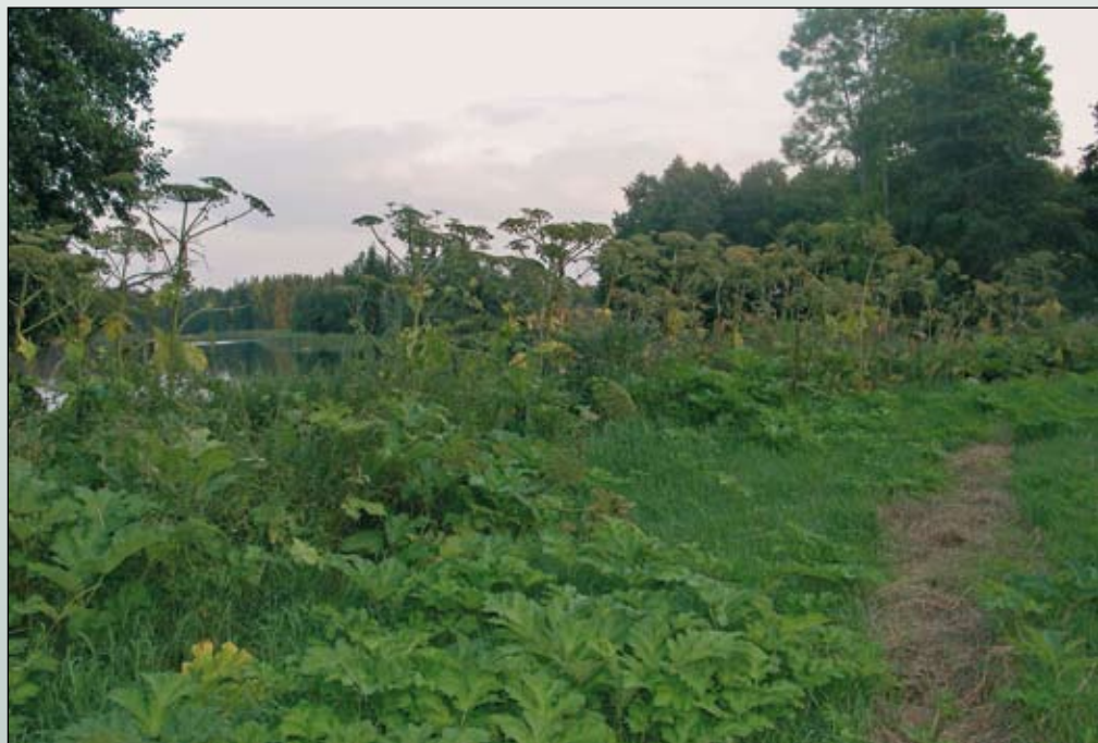
Fot. 100. Brzeg jez. Koleśne z barszczem Sosnowskiego - stan przed podjęciem zabiegów jego zwalczania

Sosnowskiego występującym na granicy Parku. Tym razem zastosowano kompleksowe zabiegi, polegające na: wykarczowaniu roślin, usunięciu wierzchniej warstwy gleby na obszarach, na których okazy gatunku występują w największym zagęszczeniu (na to miejsce przywieziono nową ziemię), wykonaniu głębokiej orki i wapnowaniu gleby.