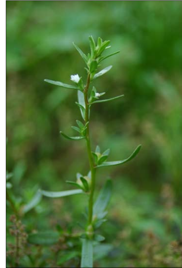
Fot. 28. Przetacznik obcy Veronica peregrina - pokrój rośliny

Rozmieszczenie w kraju: Dotychczas był notowany głównie na siedliskach antropogenicznych. Podawany był ze stawów rybnych w Kotlinie Oświęcimskiej (Zajac i Zajac 1988), a także w Kotlinach Milickiej i Żmigrodzkiej oraz z terenu Borów Dolnośląskich (Kącki i Dajdok, mat.