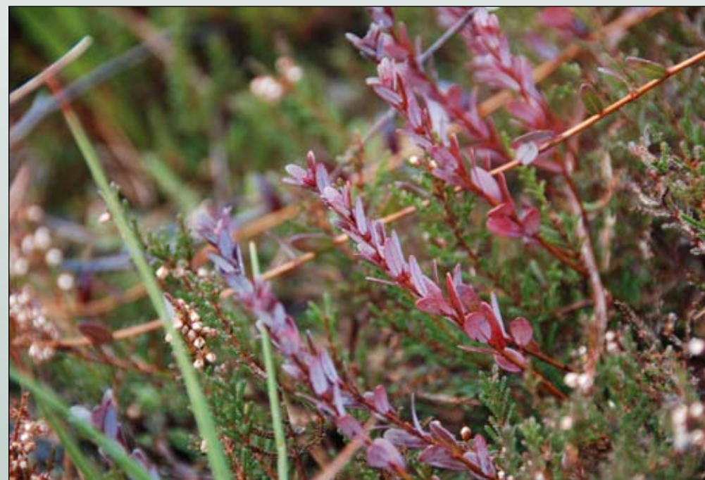
Fot. 79. Żurawina wielkoowocowa – pokrój gatunku