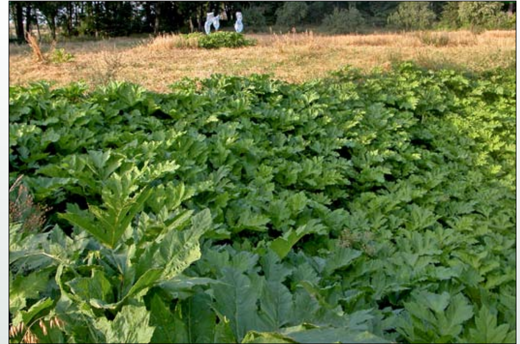
Fot. 97. Barszcz Sosnowskiego tworzy często zwarte łany wypierając inne gatunki roślin, na zdjęciach stanowisko z Małej Huty (Fot. L. Krzysztofiak)

Te doświadczenia skłoniły do bardziej kompleksowych i radykalnych działań. Jeżeli w glebie znajduje się potężny bank nasion tego gatunku, który zapewnia odnawianie się roślin w kolejnych latach, to należy zastosować takie rozwiązanie, które będzie polegało nie tylko na niszczeniu rosnących roślin, ale również nasion zdeponowanych w glebie. W latach 2007-2008, przy wsparciu finansowym Fundacji EkoFundusz, podjęto kolejną próbę walki z barszczem