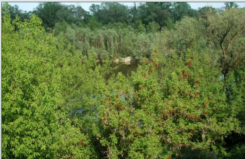
Fot. 84. Fragment łągi wierzbowo-topolowego na brzegu Wisły poniżej Włocławka z licznym udziałem klonu jesionolistnego (na pierwszym planie)

hamować wzrost rodzimych gatunków drzew. Utrudniając proces naturalnego odtwarzania się lasów, gatunek ten może powodować straty gospodarcze (Seneta i Dolatowski 1997; Solarz i in. 2005). W związku z tym należy zaprzestać nasadzenia klonu jesionolistnego na terenach zielonych i w przydrożnych pasach zadrzewień, zwłaszcza w pobliżu terenów chronionych i innych obszarów cennych z przyrodniczego punktu widzenia. Gatunek powinien być stopniowo usuwany z obszarów chronionych w czasie prowadzenia zabiegów gospodarki leśnej oraz zabiegów ochronnych. Usuwanie osobników dorosłych należy prowadzić mechanicznie, a pozostałości roślin należy w sposób kontrolowany spalać w pobliżu miejsca pozyskania (Solarz i in. 2005). Nie zawsze można i raczej w ogóle nie powinno się stosować oprysków chemicznych zawierających glikofosforan np. Roundup lub herbicydy 2,4 D aminowe. Zabrania się używać takich środków w bezpośrednim sąsiedztwie ujęć wody, na terenie uzdrowisk oraz w otulinie obszarów chronionych. Nawet jeśli nie mamy do czynienia z powyższymi sytuacjami to warto pamiętać, że takie środki mają działanie toksyczne dla organizmów wodnych np. płazów.