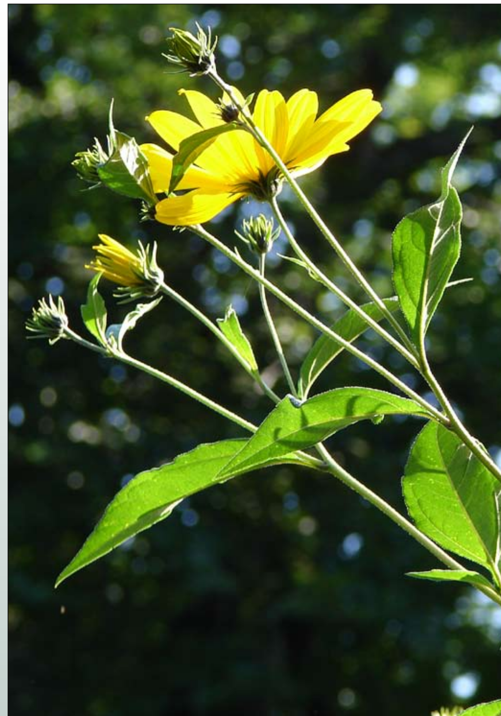
Fot. 68. Słonecznik bulwiasty Helianthus tuberosus - pokrój

Pochodzenie: Słoneczniki występujące współcześnie w Europie pochodzą w większości ze wschodniej części Ameryki Północnej. Rekonstrukcja ich oryginalnych, historycznych zasięgów jest znacznie utrudniona długotrwałym wpływem człowieka. Przed pojawieniem się człowieka, na terenie Ameryki, było prawdopodobnie 5 odrębnych jednorocznych gatunków słoneczników o częściowo izolowanych zasięgach ( H. agrophyllus , H. annuus , H. exsilis , H. petiolaris , H. debilis var. cucumerifolius , H. debilis var. debilis ). W czasach przedkolumbijskich gatunki te uprawiano jako jarzyny i wówczas powstały pierwsze mieszańce ( H. annuus x H. petiolaris ), które rozprzestrzeniły się jako rośliny uprawne i ruderalne. W okresie nowożytnym nastąpiło nasilenie ich krzyżowania i ekspansja mieszańców, a także przeniesienie do uprawy w Europie i na inne kontynenty. Utrzymanie w uprawie umożliwiło z czasem ich pojawienie i rozprzestrzenianie się w zbiorowiskach ruderalnych i nadrzecznych (Kornaś i Medwecka-Kornaś 2003; Faliński 2004). Najszerzej rozprzestrzenione i jednocześnie uważane za stwarzające zagrożenie dla miejscowej szaty roślinnej są taksony należące do grupy słonecznika bulwiastego Heliantus tuberosus agg., których identyfikacja jest nadal problematyczna.