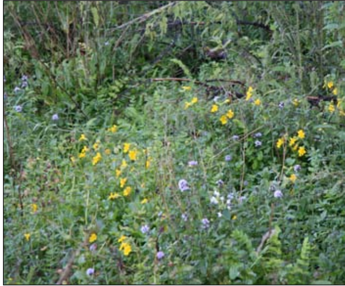
Fot. 38. Kroplik żółty w zióloroślach na brzegach rowów, na torfowisku źródłiskowym Gogolewko na Pomorzu

zik 2005). Największe zagęszczenie stanowisk ma miejsce w rejonie Karkonoszy i Kotliny Jeleniogórskiej, skąd wzdłuż dolin większych rzek, a przede wszystkim Bobru, gatunek rozprzestrzenił się na północ. Znaczna liczba stanowisk występuje także we wschodniej części ziemi kłodzkiej, skąd z kolei rozprzestrzenił się wzdłuż Nysy Kłodzkiej. Na Pomorzu znane stanowiska wykazują zagęszczenie w okolicach Polanowa i Bytowa.