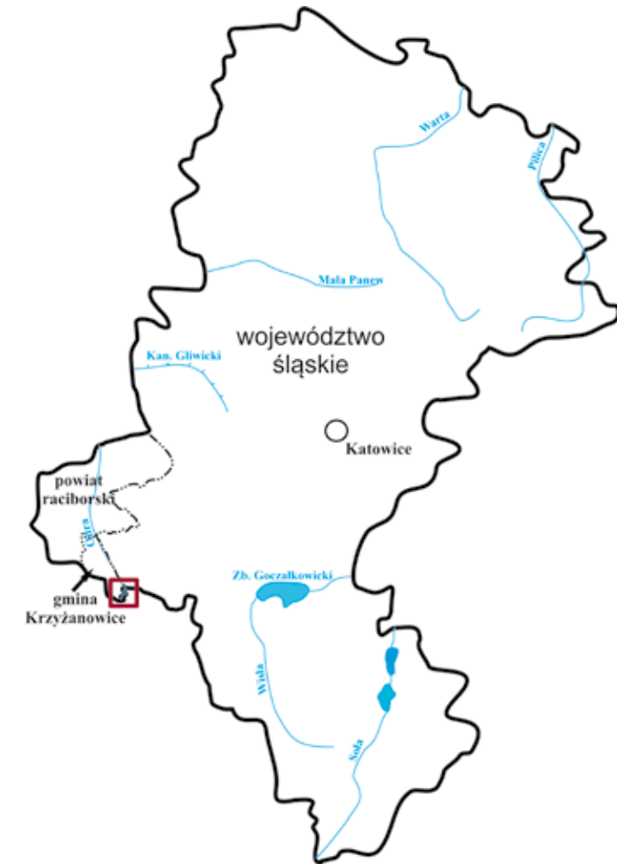
Lokalizacja obszaru chronionego krajobrazu „Graniczny meander Odry” na tle jednostek administracyjnych.