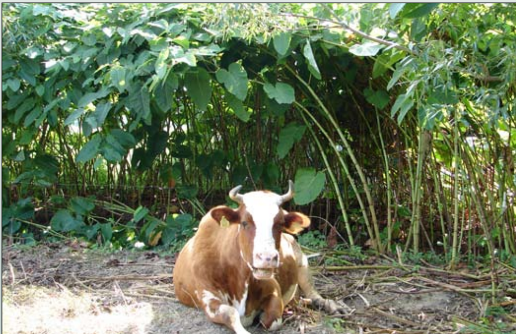
Fot. 67. Stosowanie wypasu na powierzchniach opanowanych przez rdestowce w czasie kiedy ich łodygi są już zdrewniałe nie przynosi efektów

Zwolenników zyskują metody biologiczne, będące w wielu przypadkach, bardziej skuteczne i tańsze (Luken i Thieret 1997; Cronk i Fuller 2001). Polegają one na zastosowaniu odpowiednio dobranego roślinożercy - optymalnie monofaga - lub patogenu grzybowego. Tradycyjną metodą, zastosowaną w Anglii i USA, jest wypas (Fot. 67). Rdestowiec jest rośliną jadalną dla bydła, owiec, koni, osłów; do wielu miejsc w Europie został wprowadzony właśnie jako roślina paszowa (Child i Wade 2000). Zwierzęta preferują jednak tylko młode pędy, latem szybko rosnące łodygi silnie drewnieją. Wypas zazwyczaj ogranicza rozprzestrzenianie się rośliny, nie eliminując jej jednak całkowicie.