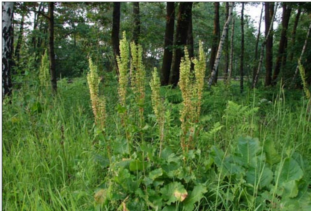
Fot. 45. Szczaw omszony Rumex confertus na skraju lasu mieszanego w południowej części Katowic, w pobliżu skrzyżowanie drogi z linią kolejową