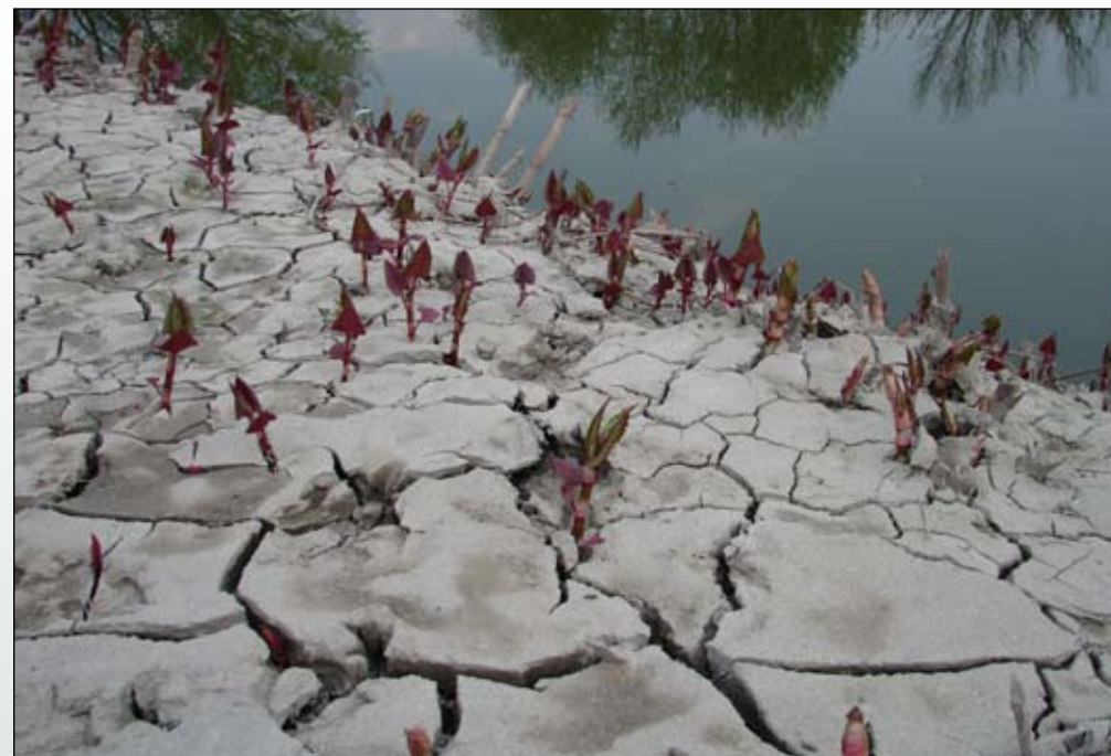
Fot. 57. Pędy rdestowca ostrokończystego wyrastające z podziemnych kłęcz na brzegu starorzecza Odry

Czas i droga zawleczenia: Rdestowiec ostrokończysty został sprowadzony do Europy z Japonii jako roślina ozdobna, prawdopodobnie przez Philippe von Siebolda, który przebywał w tym