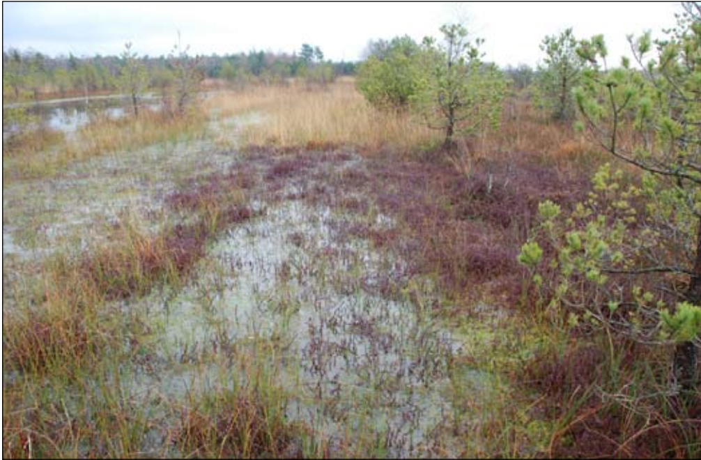
Fot. 82. Płat żurawiny wielkoowocowej na torfowisku Krakulice

Aktualnie żurawina wielkoowocowa zajmuje powierzchnię ok. 100 m 2 . Jej ekspansja jednak mogła być ograniczana przez trudne warunki siedliskowe: przesychnanie torfowiska w okresie letnim, a zalewanie w okresie wiosenno-zimowym.