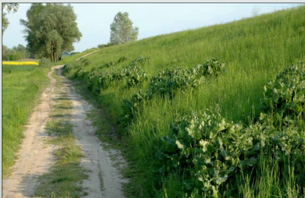
Fot. 46. Kępy szczawiu omszonego na wewnętrznej skarpie wału przeciwpowodziowego Wisły poniżej Włocławka

Beskidzie Niskim i Bieszczadach Zachodnich, gdzie rośnie na wysokości dochodzącej nawet do 690 m n.p.m. (Tacik 1992). Gatunek ten jednak stale rozszerza swój zasięg na północ i zachód, gdzie może być wciąż uważany za efemerofita.