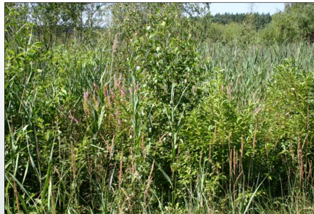
Fot. 76. Tawuła kutnerowata występująca pojedynczo na obrzeżach Torfowiska Osowiec w Puszczy Drawskiej