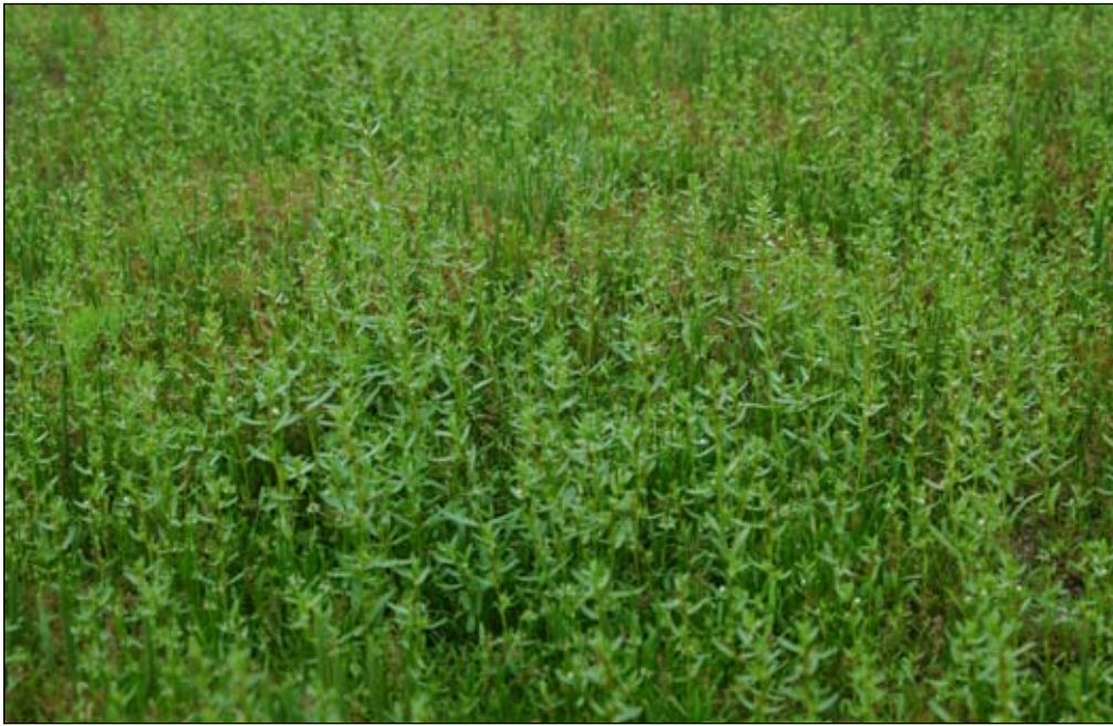
Fot. 29. Płat zbiorowiska z udziałem przetacznika obcego, myszurka drobna i koleantusa delikatnego na dnie jednego ze stawów koło Borowej Oleśnickiej

Zagrożenia dla ekosystemów: Gatunek potencjalnie konkurencyjny dla rodzimych roślin wchodzących w skład zbiorowisk namuliskowych. Dotychczas podawany przede wszystkim ze stawów hodowlanych. Płaty roślinności z jego udziałem wykształcają się na brzegach lub dnie stawów w okresie ich opróżniania. Gatunek ten na obecnym etapie zdomowienia nie wydaje się mieć znaczenia dla rozwoju innych gatunków namuliskowych. W dostępnej literaturze brak danych na ten temat. Jednak istotny wydaje się fakt współwystępowania przetacznika obcego z rzadkimi roślinami, często o niewielkich liczebnie populacjach, jak np. lindernia mułowa Lindernia procumbens czy koleantus delikatny Coleanthus subtilis . Zbliżone wymagania tych gatunków sprawiają, że w płatach roślinności namuliskowej obecność przetacznika obcego może mieć wpływ na strukturę i bogactwo gatunkowe tych zbiorowisk. Na stanowiskach dolnośląskich przetacznik obcy notowany był w płatach zazwyczaj sporadycznie. Wyjątkiem są zbiorowiska na Stawach w Borowej Oleśnickiej (Fot. 29), gdzie gatunek wykazuje znaczne pokrycie i wysoką stałość w płatach, miejscami osiągał ponad 20% udziału w pokrywaniu ich powierzchni.