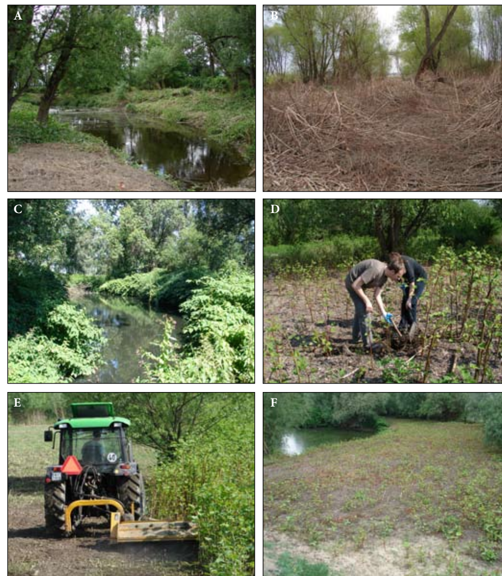
Fot. 94. Sytuacja na obszarze Natura 2000 „Graniczny meander Odra”: A – przed podjęciem działań; B – po zastosowaniu wycinania; C – odrastanie rdestowców po wycinanie; D – wykopywanie ręczne; E – wykaszanie mechaniczne; F – odrastanie rdestowców po zastosowaniu wycinania

W celu zachowania istniejących jeszcze nienaruszonych mikrosiedlisk, które stanowią o niepowtarzalnym charakterze tego obszaru, a także przywróceniu wielu fragmentom tego obszaru ich naturalnych cech, wdrożono projekt zwalczania tych gatunków (Fot. 94). Program, którego realizację rozpoczęto w 2005r., stanowi integralną część wspomnianego powyżej projektu „Przestrzeń dla rzeki”. Jednym z jego zadań było nie tylko wdrożenie programu zwalczania rdestowców i umożliwienie naturalnej sukcesji roślinności ale także monitorowanie zachodzących zmian w szacie roślinnej.