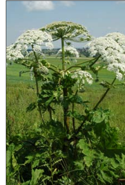
Fot. 33. Barszcz Sosnowskiego Heracleum sosnowskyi – pokrój rośliny

Pochodzenie: Oba gatunki pochodzą ze wschodniej Azji, z masywu Kaukazu, obejmującego tereny Rosji, Gruzji, Armenii i Azerbejdżanu. Zostały odkryte w różnym czasie i opisane osobno. Botanicy radzieccy prowadzili badania nad barszczami ze wschodniej części Kaukazu, gdzie dominował H. sosnowskyi (odkryty w 1772 r., opisany w 1944 r.), podczas gdy botanicy europejscy zbadali trudno dostępną, zachodnią część Kaukazu, gdzie występował H. mantegazzianum (odkryty w 1890 r., opisany w 1895 r.). Badania genetyczne potwierdziły ich bliskie pokrewieństwo, lecz również odrębność gatunkową (Jahodová i in. 2007). Nadal trwają dyskusje nad rangą obu taksonów.