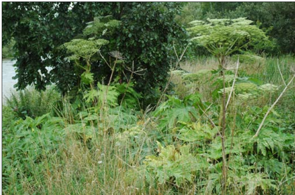
Fot. 34. Osobniki barszczu w na brzegu Nysy Łużyckiej na wysokości Bielawy Dolnej