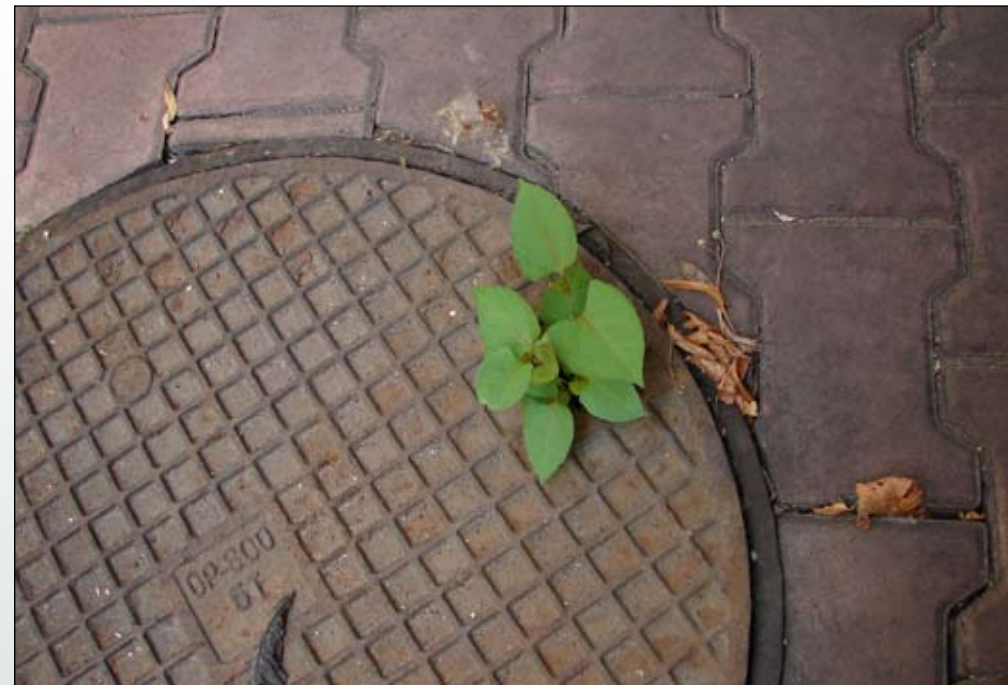
Fot. 61. Rdestowiec ostrokończysty to roślina najczęściej spotykana na siedliskach ruderalnych. Może rosnąć nawet w ekstremalnych warunkach