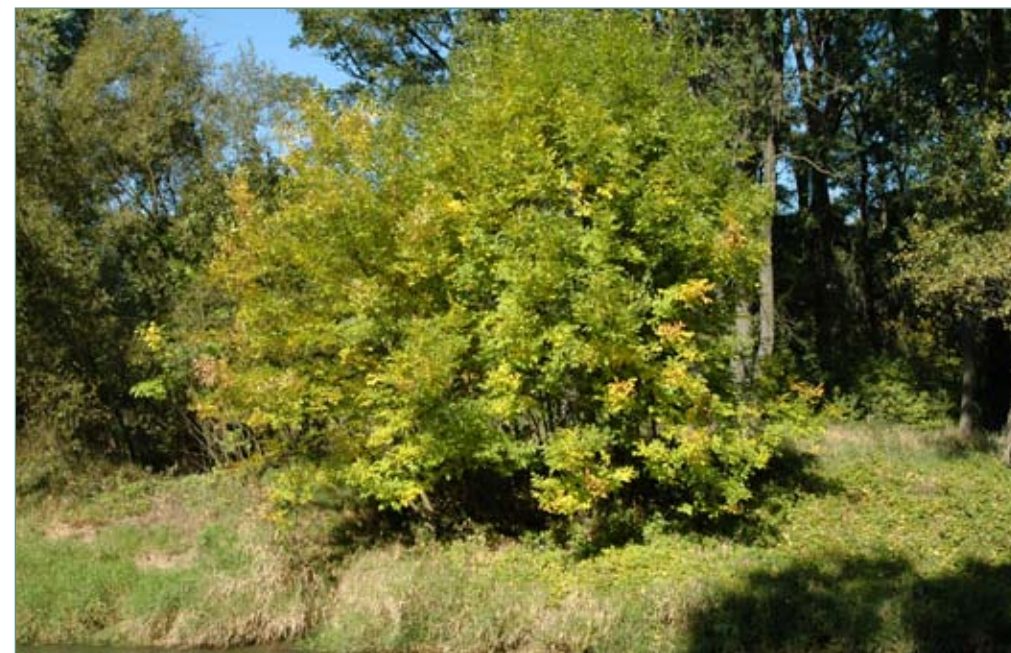
Fot. 85. Jesion pensylwański Fraxinus pensylvanica na brzegach Bystrzycy w okolicy Kątów Wrocławskich

Jesion pensylwański Fraxinus pensylvanica Marsh ( Fraxinus darlingtonii Britton; (incl.); Fraxinus pubescens Lam.; Fot. 86) to drzewo wprowadzone do Europy w 1783 r. W Polsce rósł już w 1817 r. w Niedźwiedziu koło Krakowa (Hereźniak 1992; Tokarska-Guzik 2005). W rodzimej Ameryce Północnej występuje na rozległych obszarach. Jest najbardziej rozpowszechniony spośród amerykańskich jesionów. Ma podobny zasięg do klonu jesionolistnego. Rozpóściiera się on na całym wschodnim wybrzeżu Stanów Zjednoczonych aż po Nową Szkocję w Kanadzie. Rośnie zwykle na glebach żyznych i wilgotnych, a nawet podmokłych, ale również na suchych glebach prairii. Najczęściej jednak jego naturalne populacje znajdują się w dolinach rzek i strumieni, na