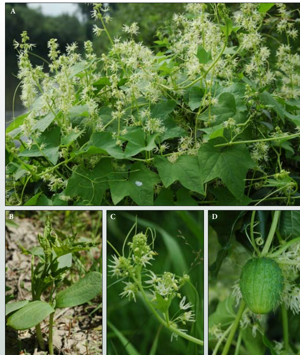
Fot. 22. Kolczurka klapowana Echinocystis lobata : A – pokrój, B – siewka i młode okazy z pierwszymi liśćmi, C – szczytowa część kwitnącego pędu; D- owoc

Rozmieszczenie w Polsce: Poza uprawą kolczurka klapowana jest obecnie znana niemal z całej Polski. Najwięcej stanowisk koncentruje się w części południowo-wschodniej, gdzie wzdłuż niektórych rzek spotyka się płaty zbiorowisk zdominowanych przez ten gatunek. Szczególnie często jest odnajdywana na odcinkach rzek, których brzegi były umacniane i powierzchnia gruntu przez jakiś czas nie była zadarniona (Fot. 23, 24). Gatunek ten jest zaliczany do grupy roślin obcych, które odniosły sukces w kolonizacji polskiej części Karpat (Zajac i Zajac 2001).