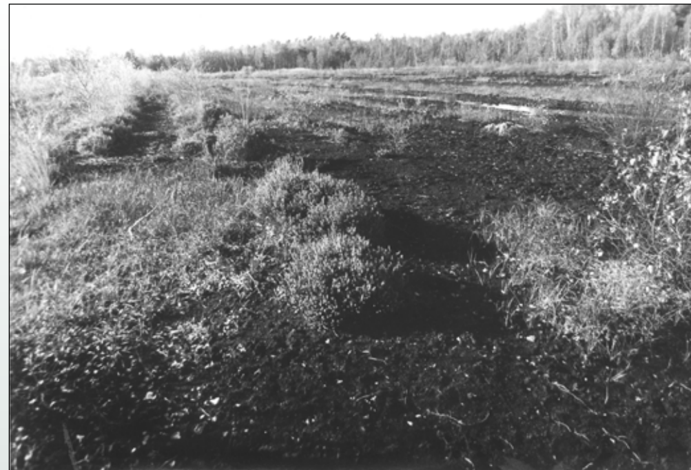
Fot. 80. Powierzchnia doświadczalna na torfowisku Krakulice, na którą wprowadzono żurawinę wielkoowocową – widok w roku 1990

Zajmowane siedliska: Na torfowisku Krakulice w połowie lat 90. zakończono eksploatację tego fragmentu torfowiska. Obecnie w miejscu występowania żurawiny (Fot. 81, 82) na nagim zmurzonym torfie występują krzewinki wrzosu zwyczajnego i wrzośca bagiennego, rowy wzdłuż byłych powierzchni frezowanych oraz na obrzeżach niżej położonych powierzchni frezowanych, na których powstają zastoiska wodne, zarasta trzęślica modra. W głąb wody sięga wełniaka wąskolistna oraz torfowiec kończysty. Siedlisko ulega stopniowej spontanicznej regeneracji. Podrost drzew utworzony przez naloty sosny i brzozy jest niewielki. Wysokość drzew sięga do 2-3 m wysokości, część z nich jest już martwa ze względu na wysokie stany wody szczególnie w miesiącach wczesnowiosennych i jesiennych. Od 2007 r. wyższy i stały poziom wody na torfowisku utrzymuje się w wyniku zamontowania na jego obrzeżach zastawek, zapobiegających przesychnianiu złoża.