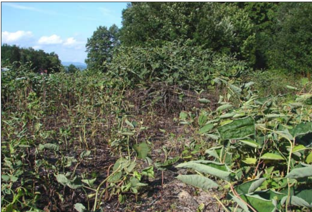
Fot. 89. Rdestowiec sachaliński po zastosowaniu oprysku