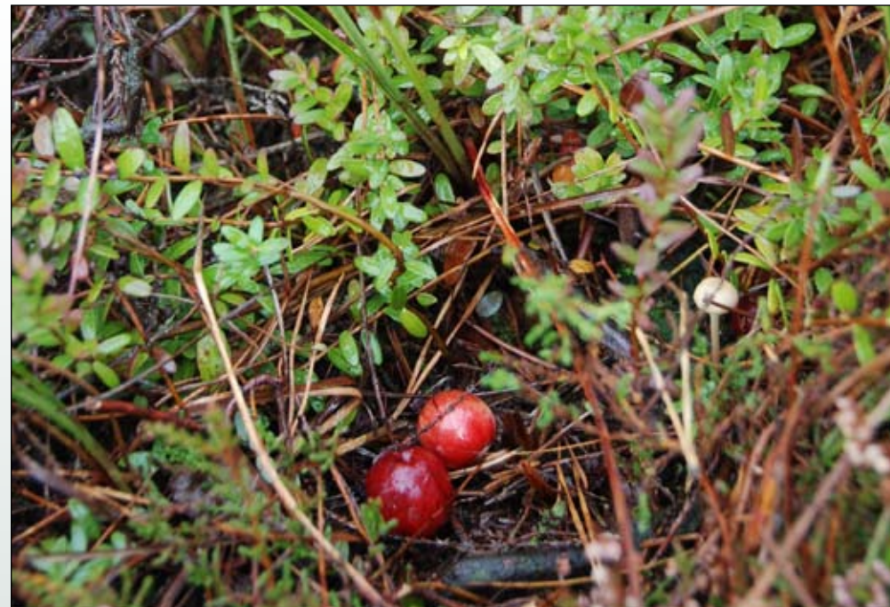
Fot. 78. Żurawina wielkoowocowa Oxycoccus macrocarpos – pokrój gatunku

Czas i droga zawleczenia: W związku z uprawą, gatunek został rozpowszechniony w całej Ameryce, aż po wybrzeże Pacyfiku, w wielu miejscach „uciekł” z uprawy. Do Europy żurawina wiel-