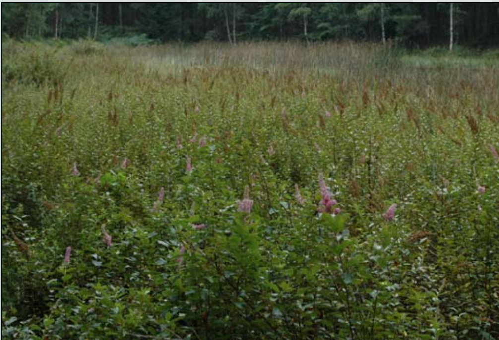
Fot. 7. Łan tawuły kutnerowatej całkowicie zarastającej torfowisko