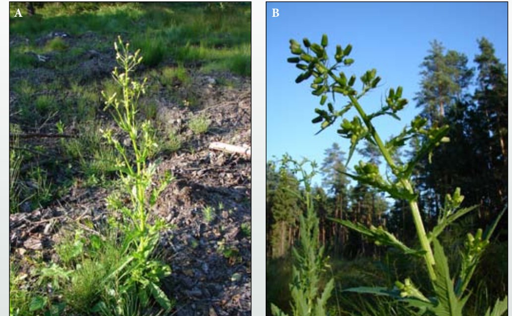
Fot. 20. Erechtites jastrzębcowaty Erechtites hieracifolia : A - pokrój rośliny, B - górna część pędu z licznymi koszyczkami, w których zebrane są kwiaty

Barbara Tokarska-Guzik, Piotr Górski i Aneta Czarna