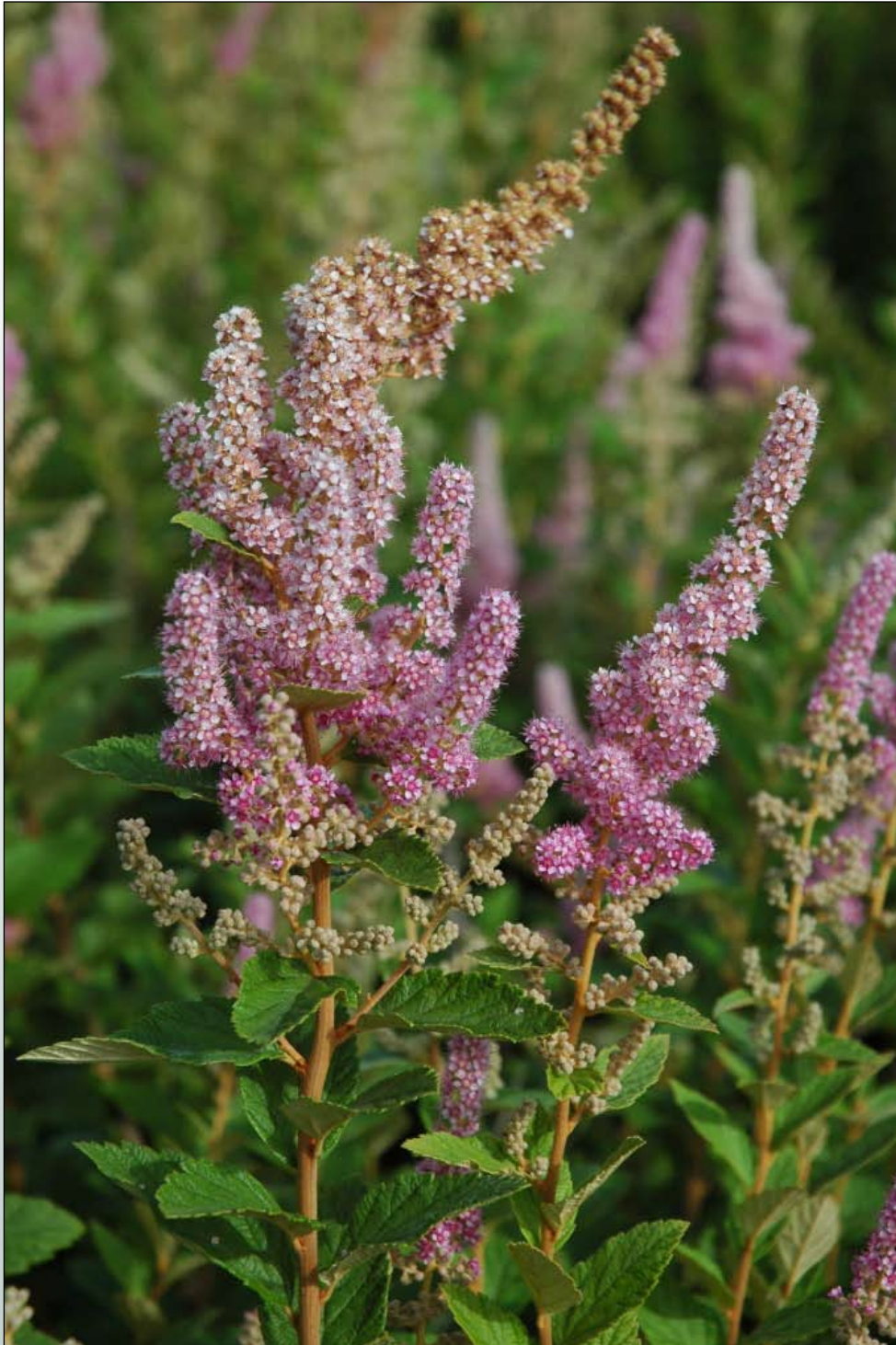
Fot. 71. Pokrój kwiatostanu tawuły kutnerowatej Spiraea tomentosa

Tawuła kutnerowata w warunkach Polski rozprzestrzenia się głównie przy udziale podziemnych rozłogów, zajmując coraz większe powierzchnie. Kolejne torfowiska zasiedla jednak drogą obsiewu. Występuje głównie na torfowiskach niskich i przejściowych, na wilgotnych wrzosowiskach, na glebach torfowych i murszastych oraz na murszu. Rzadziej spotykana jest w brzezinach bagiennych, w olsach oraz na nieużytkowanych łąkach. Tworzy liczne skupienia budowane przez wiele pędów wyrastających z jednej karpki. Jedna roślina może wytworzyć ponad 100 pędów generatywnych oraz liczne rozłogi, dzięki którym udaje się kolonizować (zajmować) nowe powierzchnie. Tworzy wówczas niemal jednogatunkowe agregacje, wypierając inne gatunki roślin, w tym roślin naczyniowych i mchów.