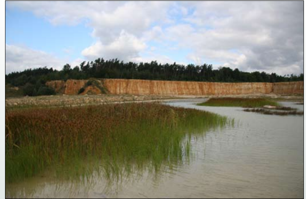
Fot. 41. Płaty szuwaru pałki wysmukłej w kamieniołomie w Górażdżach