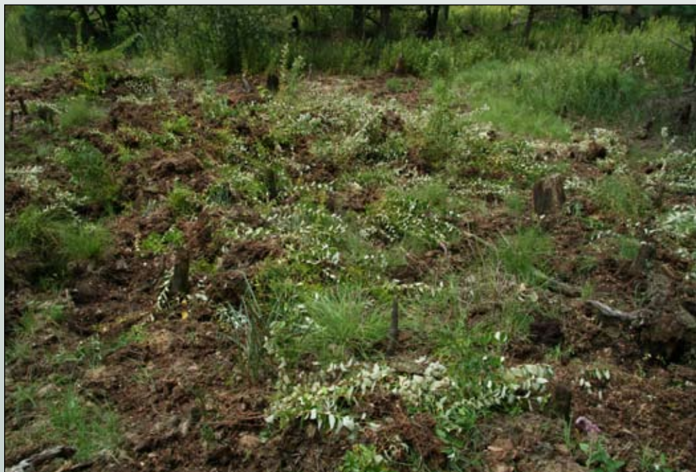
Fot. 104. Wyrwanie tawuły

Eksperymentalnie, na ograniczonych powierzchniach próbnych, zastosowano natomiast następujące metody: