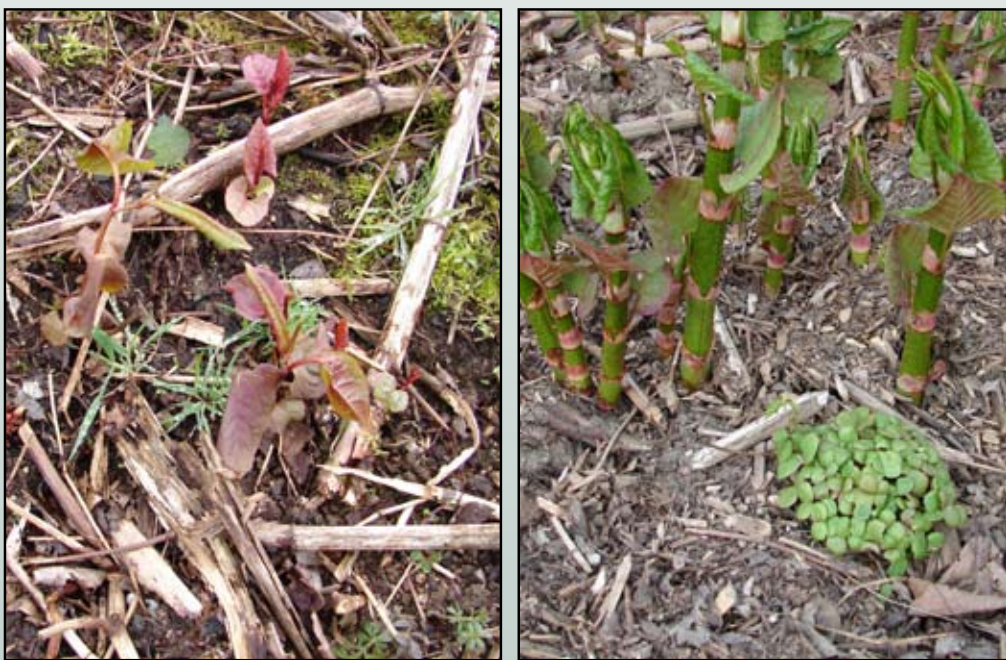
Fot. 90. Regeneracja rdestowców po zastosowanym oprysku (po lewej) i wykaszaniu (po prawej stronie) obok kielkujące siewki niecierpka gruczołowatego