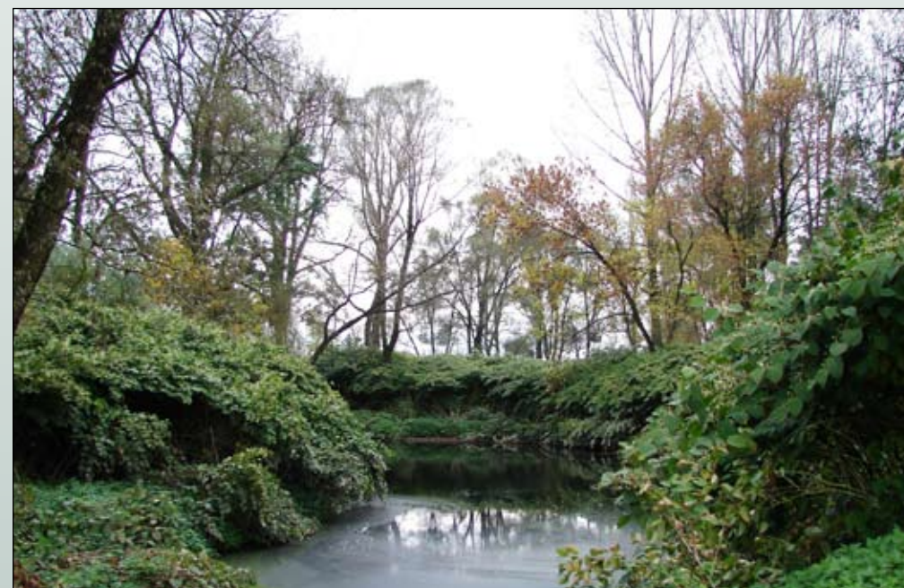
Fot. 62. Rdestowiec ostrokończysty kolonizuje także siedliska nadrzeczne. Starorzecze Odry w rejonie Chałupek (południowa Polska)