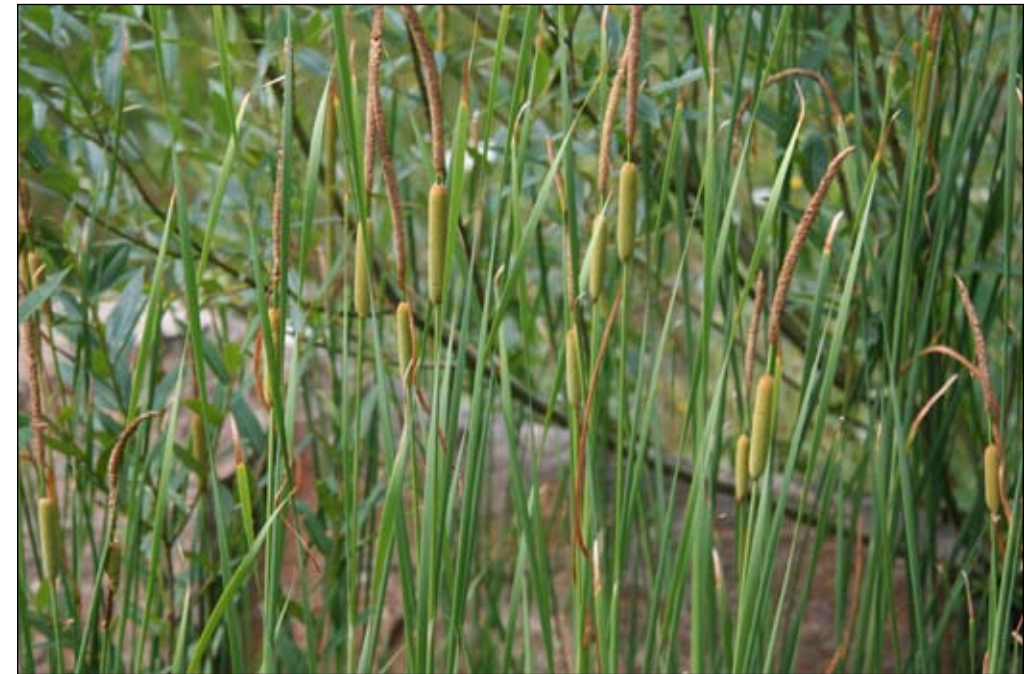
Fot. 40. Pałka wysmukła Typha laxmannii

Czas przybycia: Pałka wysmukła była w Polsce obserwowana od 1988 roku, a pierwsza publikacja na jej temat w naszym kraju ukazała się w 2003 r. (Czyłok i Baryła 2003).