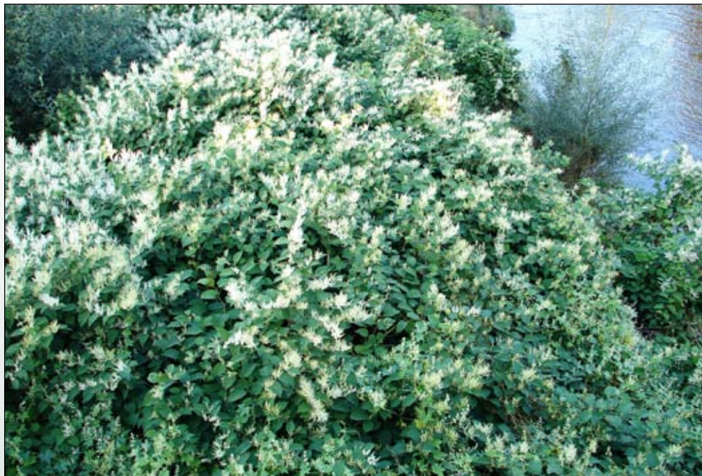
Fot. 59. Rdestowiec ostrokończysty kwitnie w sierpniu i we wrześniu